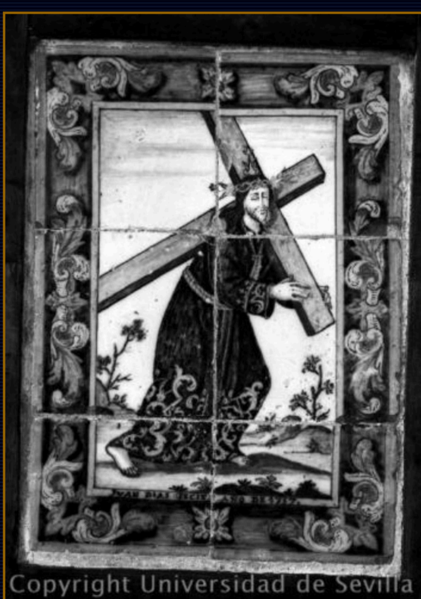
Jesús Nazareno.

Hasta el momento solo se conocían tres obras de Juan Díaz, firmadas en los tres casos: