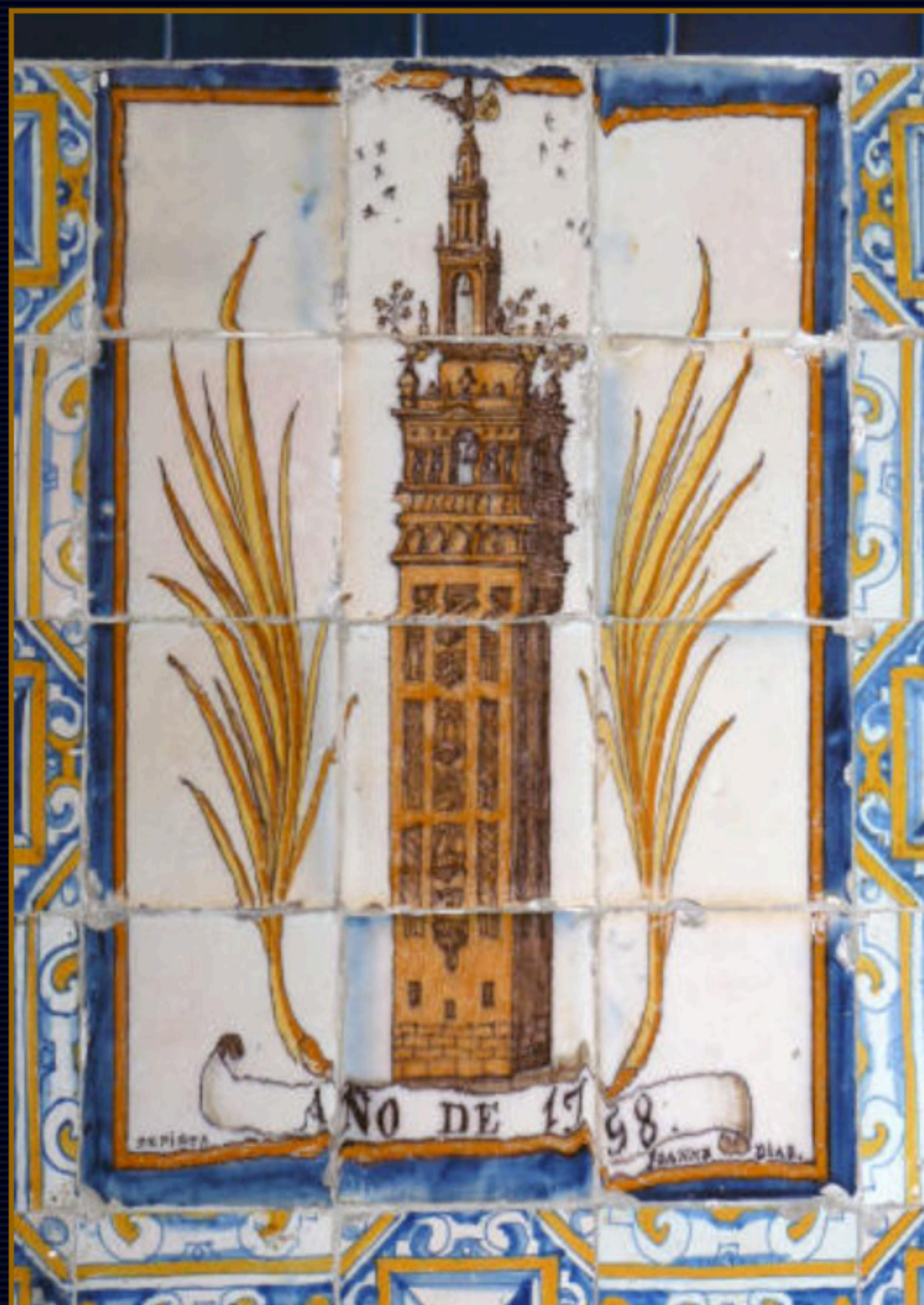
Pieza cerámica firmada en la capilla del Capitán Monte Bernardo de la Iglesia Parroquial de Santa Ana.

Una Nuestra Señora de Gracia en una colección privada de Carmona, a la que se hace referencia por el profesor Alfonso Pleguezuelo Hernández y de la que no disponemos de información gráfica.