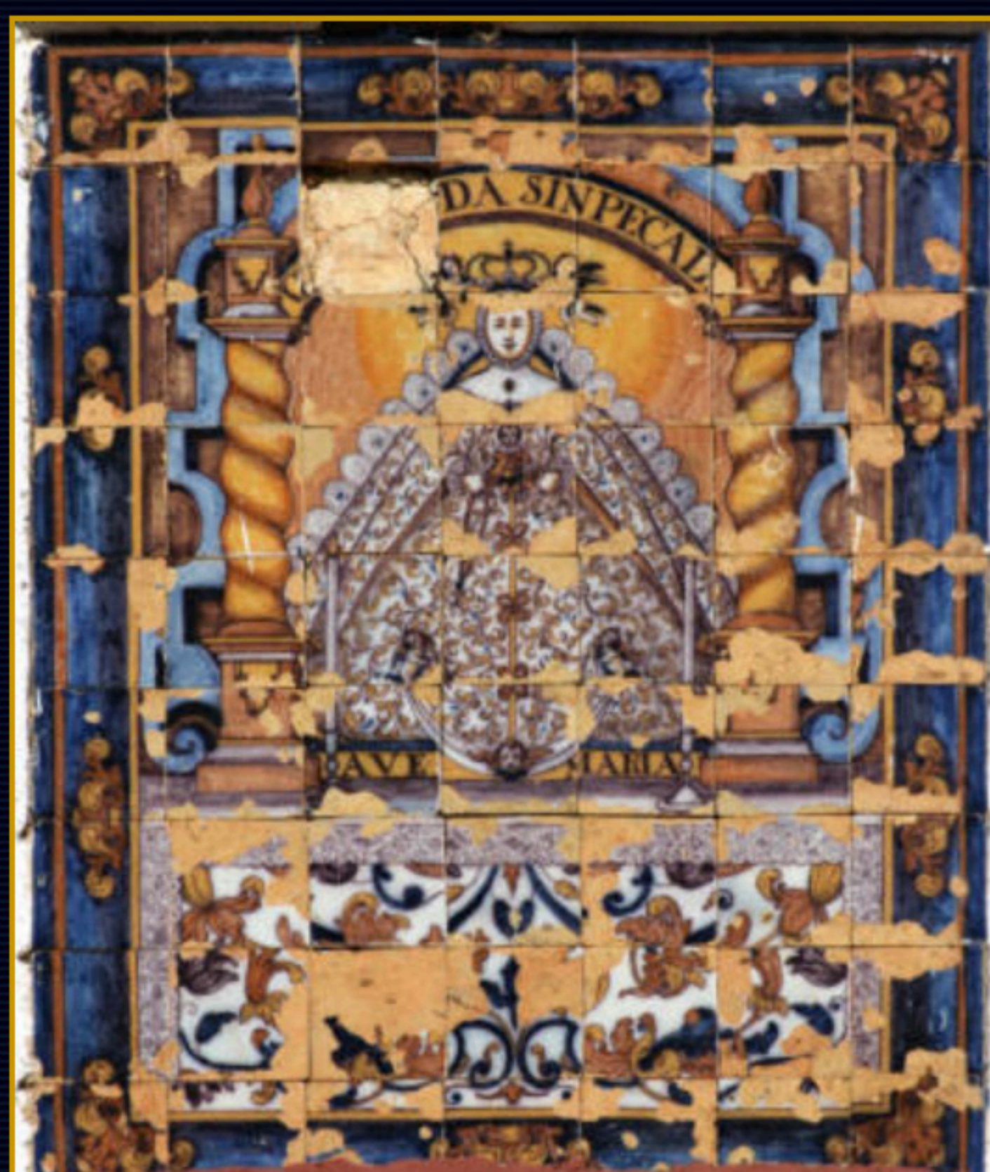
La pieza no está firmada, pero una placa en la zona inferior indica su autoría.

Encontrar pues una obra firmada no es tarea fácil, así pues cuando esta ocasión se presenta, debe mostrarse al objeto de que sea estudiada y compartida por cuantos aman este arte que es la cerámica.