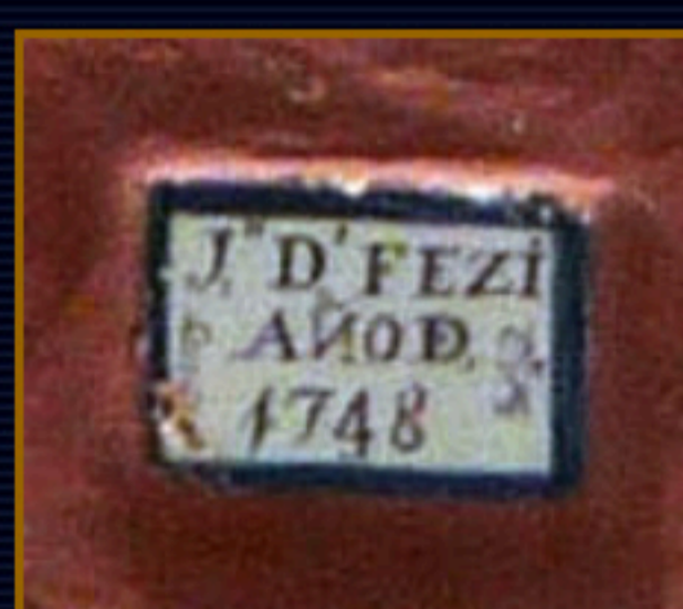
La placa indica autoría y fecha. Detalle de fotografía: Jesús Marín García

El 2 de marzo de 2009, se clasificó una pieza con el número 1717, ubicada en la Hacienda La Buzona, en el término municipal de Carmona (Sevilla), que representa a Nuestra Señora del Rosario. Esta pieza fue realizada en 1748 y presenta un estado de conservación deficiente, siendo necesaria con urgencia una restauración.