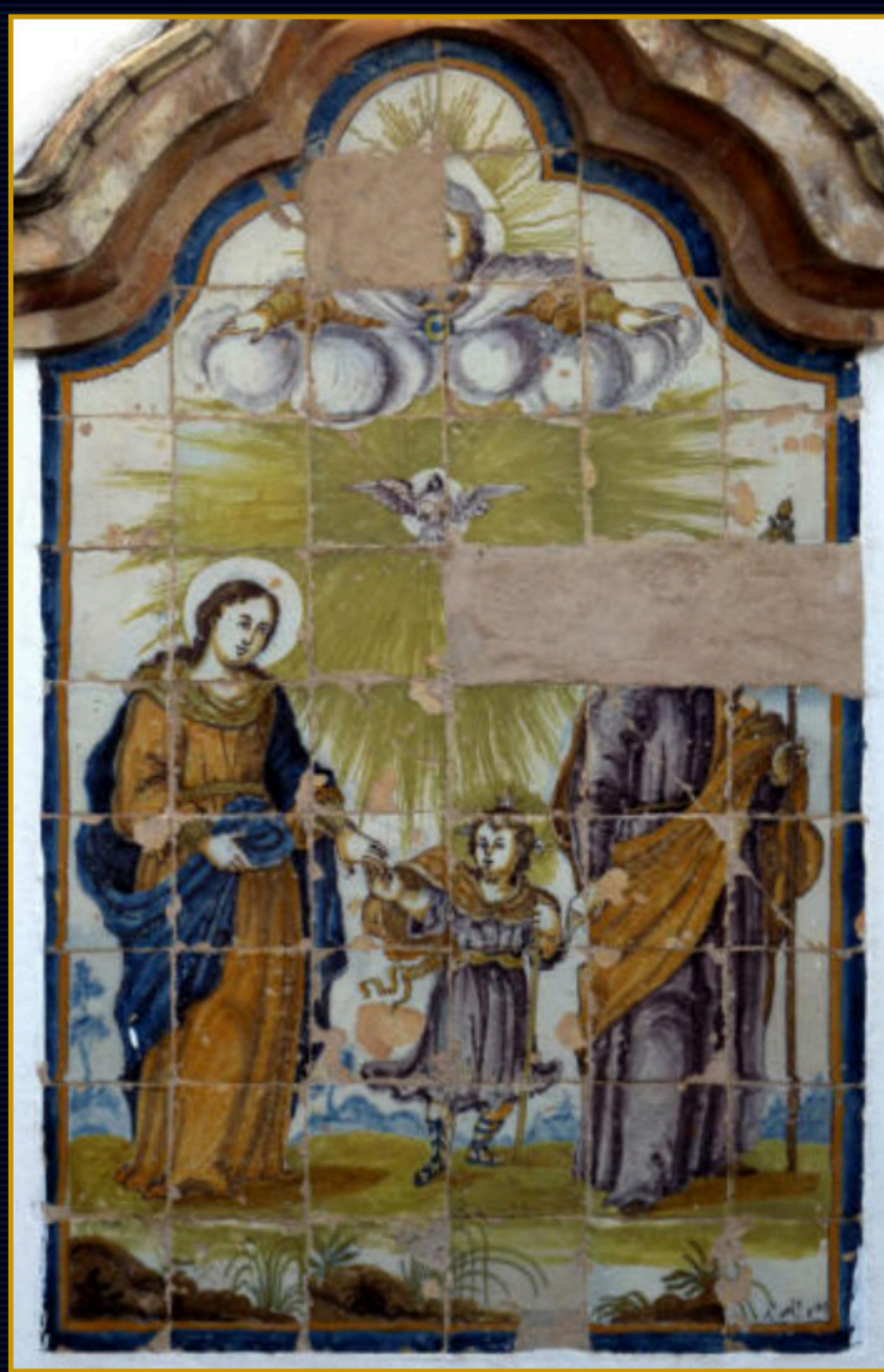
La sagrada Familia del Alcázar sevillano.

La obra, aunque no está firmada, aparece con un azulejo independiente en la zona inferior bajo el retablo indicando "J N . D' Fecit anno 1748". Sabemos de un grupo muy reducido de azulejeros que en el siglo XVIII firman alguna de sus obras siendo los más conocidos Joseph de las Casas, con obra fechada y firmada en la iglesia de Nuestra señora de la O en la ciudad de Rota y Juan Díaz, autor este último al que me inclino el adjudicar el citado panel.