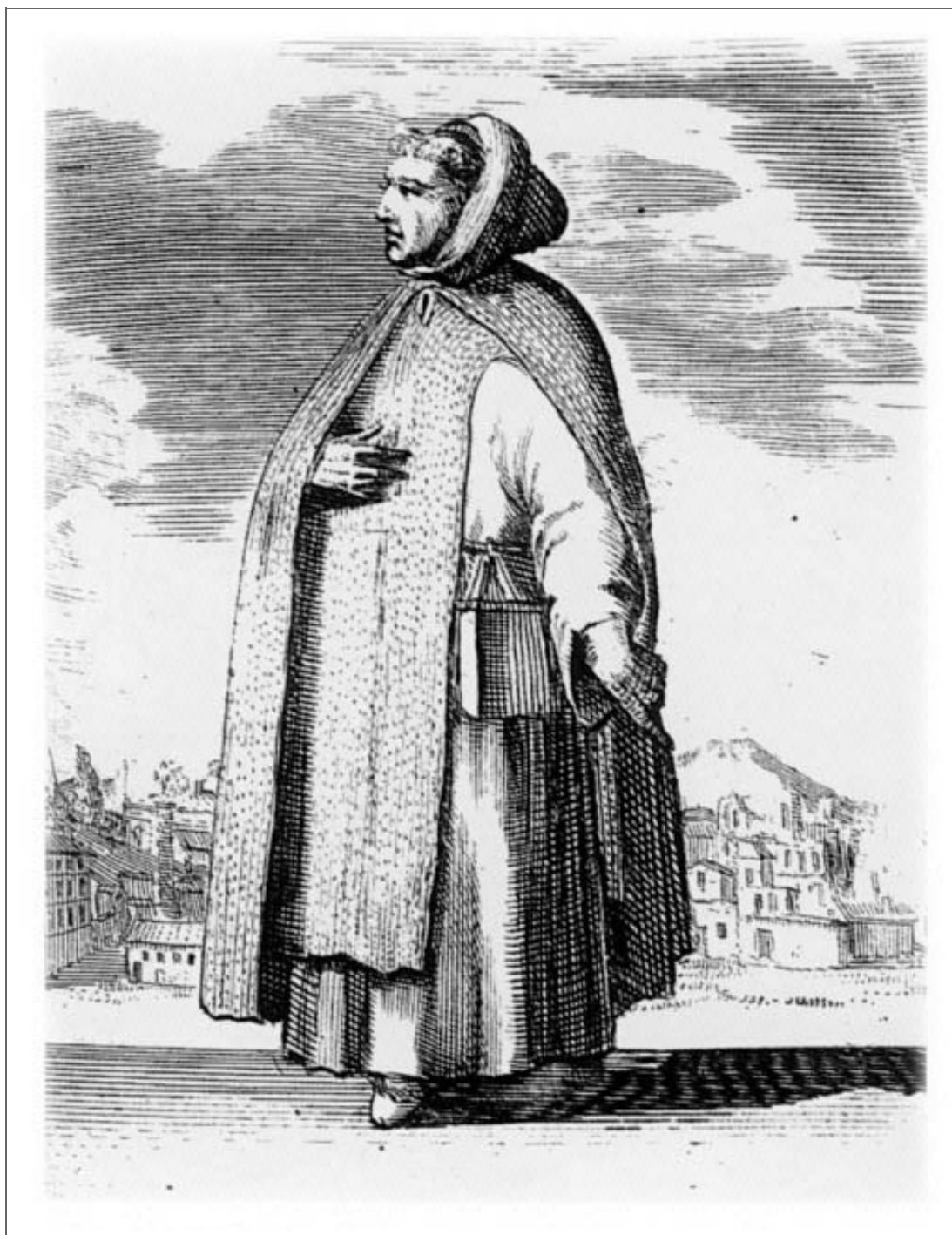
Grabado del libro “Histoire des ordres religieux” en el que se basa la pieza cerámica.

Los paneles de azulejos se encuentran firmados “I. Aalmis Pxto Rotterdam”, en un zócalo inferior inexistente en la cerámica que presentamos, que está compuesta por 15 azulejos, de los que dos han desaparecido. El motivo central está extraído de un grabado de la obra “Histoire des ordres religieux”, con grabados de Adrien Schoonebeek, fechado en 1690 en Amsterdam.