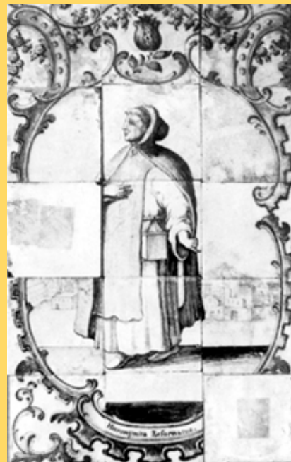
Hieronijmita Református 5