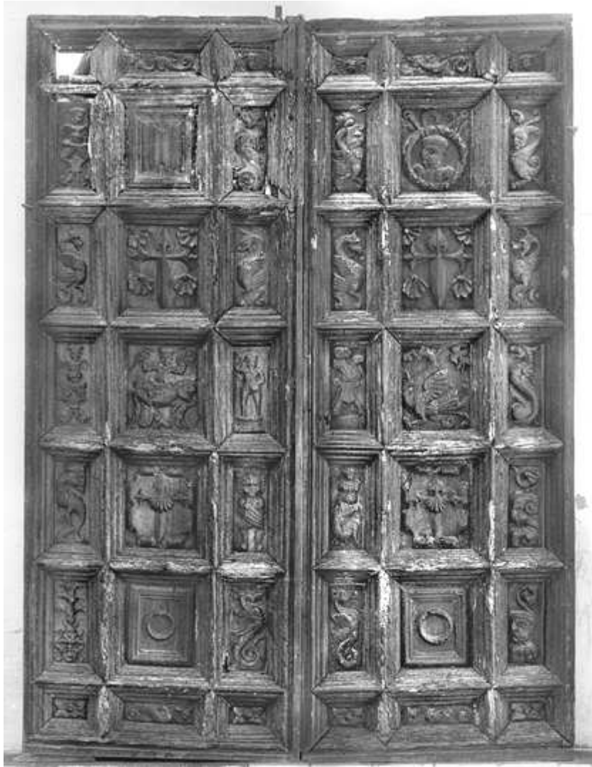
Estas eran las artísticas puertas del convento de Calera que interesaban a la Comisión Provincial de Monumentos en 1889. Hoy, con casi quinientos años de antigüedad se guardan en el Museo Provincial de Badajoz