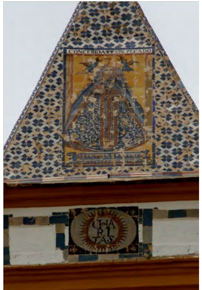
Figuras 3, 4 y 5. Vistas del panel de la Virgen de Consolación en el chapitel del santuario de Utrera.

Los cuatro paneles hagiográficos posiblemente sean de los primeros años del s. XVIII, por las características pictóricas, los pigmentos utilizados y la actuación en el remate del campanario que se acomete sobre 1713.