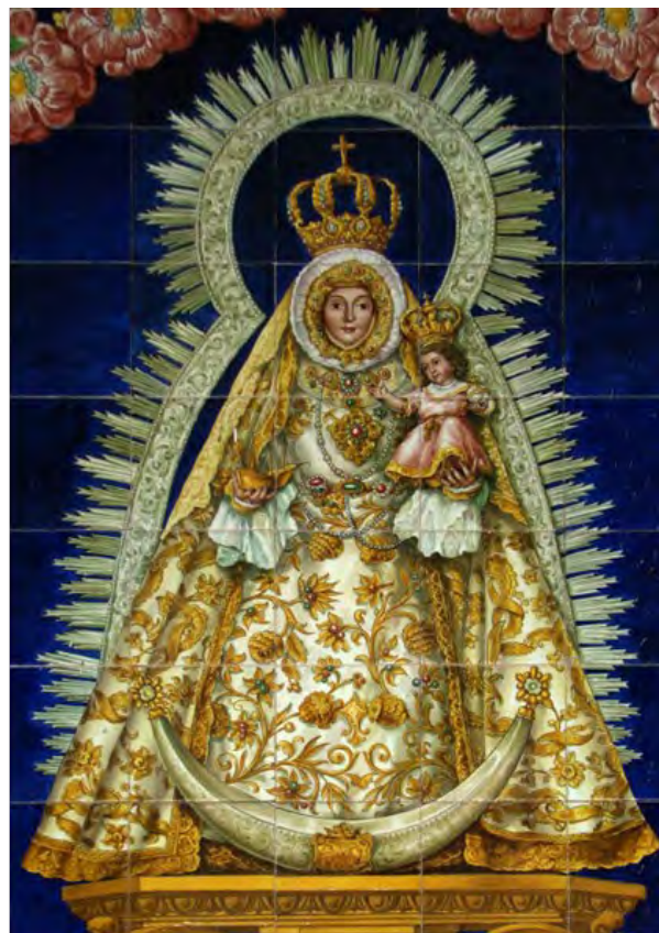
Figuras 20 y 21. Retablo de la estación de ferrocarril de Utrera y detalle