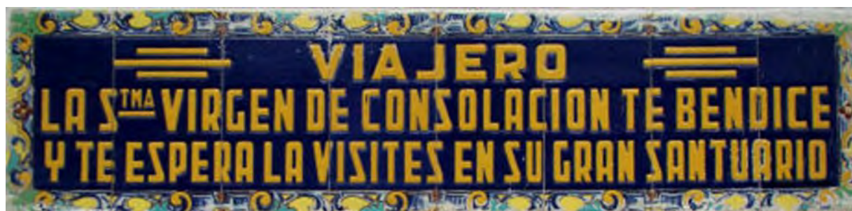
Figura 22. Texto que acompaña al retablo de la estación de Utrera.

Parecido a este último retablo, aunque de menor calidad y de menor formato, tenemos otro localizado en un domicilio particular de la calle Ramón y Cajal de Utrera. Contiene la firma de Cerámica Santa Ana únicamente y se vuelve a representar a la Virgen sobre una peana de madera dorada sobre fondo azul y orla floral. Se podría fechar igualmente en la década de 1950.