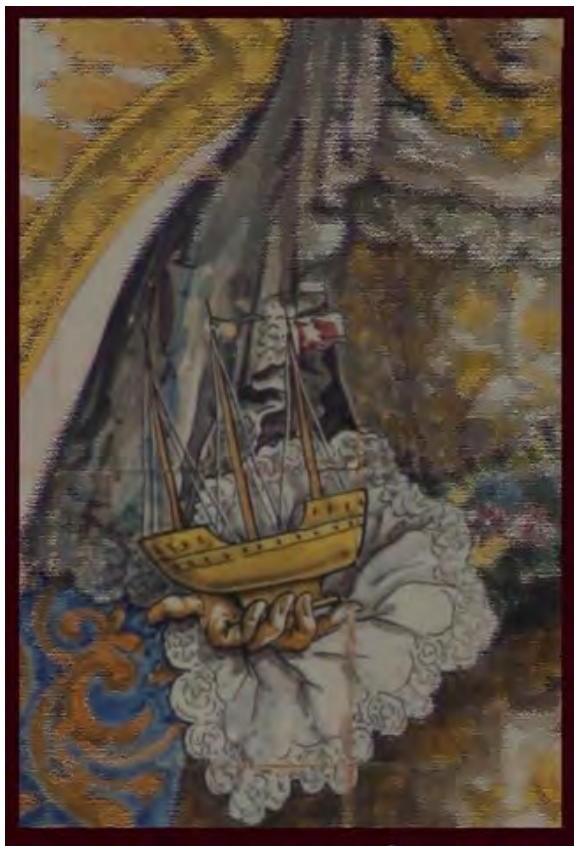
Figura 1. Composición plástica. Detalle

Con estas palabras se refieren muchas personas a la venerada y antigua imagen de Nuestra Señora de Consolación, histórica patrona de la ciudad de Utrera (Sevilla). Sin lugar a dudas uno de los simulacros marianos más importantes y venerados de la provincia de Sevilla, cuyo signo parlante más célebre es el barquito que porta en la mano derecha. Aunque como veremos y gracias a la cerámica por ejemplo, no siempre lo llevó.