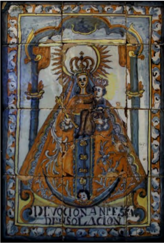
Figura 2. Retablo de San Juan de Aznalfarache