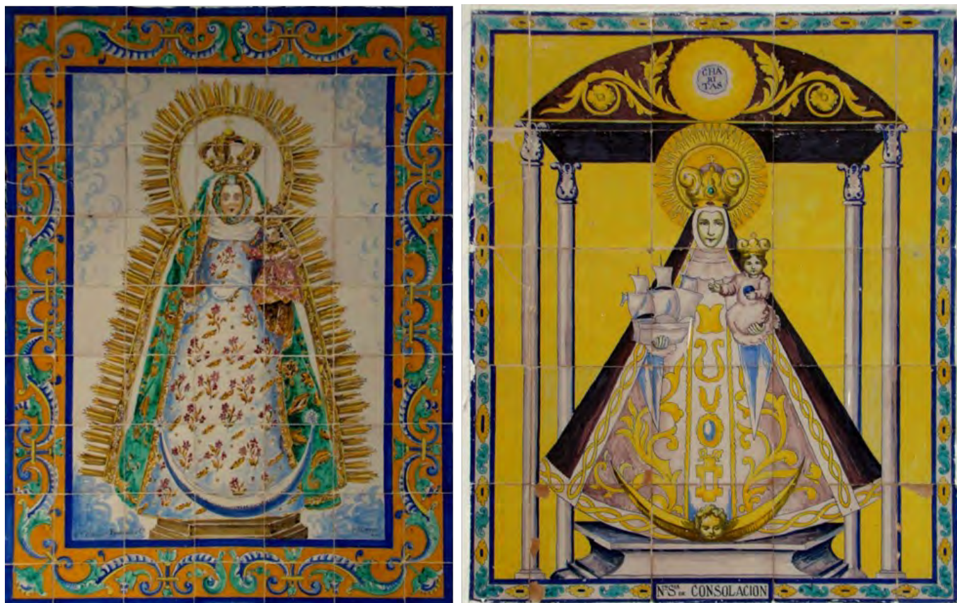
Figuras 18 y 19. Retablos del convento de las Hermanas de la Cruz y de la parroquia de Santa María de la Mesa de Utrera.

Fechados aproximadamente en la década de 1930, nos encontramos con dos obras de diferente estilo y autoría dentro de Utrera.