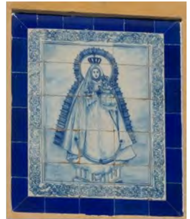
Figuras 28, 29, 30 y 31

Figura 28.- Azulejo de Ruiz de Luna (Talavera) conservado en el Museo Naval del Viso del Marqués (Ciudad Real).