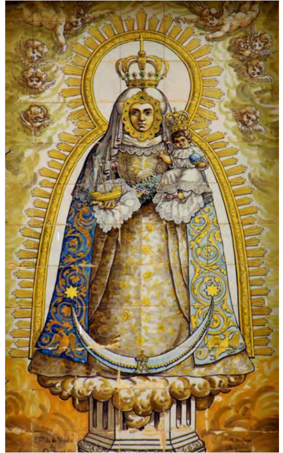
Figuras 12 y 13. Retablos del cortijo de Juan Gómez y de la fachada del santuario.