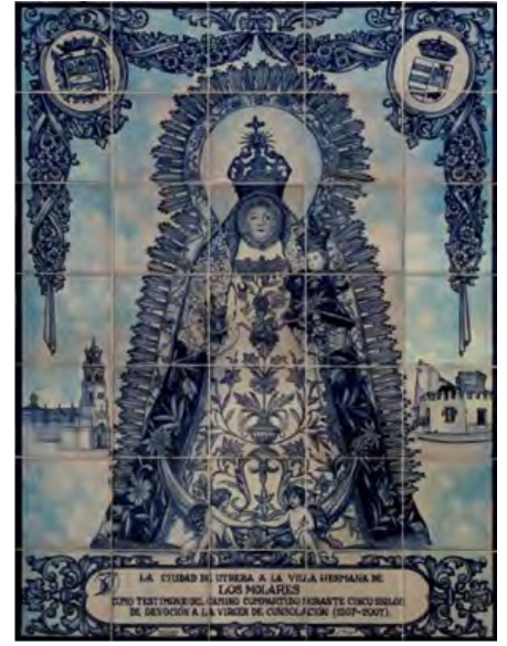
Figuras 24, 25, 26, y 27. Retablos cerámicos del año 2007 en Mairena del Alcor, Los Palacios y Villafranca y Los Molares.

Sirva este escrito para dejar constancia de la devoción a la Virgen de Consolación a través de la cerámica artística y como homenaje a la ciudad de Utrera en la celebración del encuentro de la web retablocerámico el día 15 de mayo de 2022.