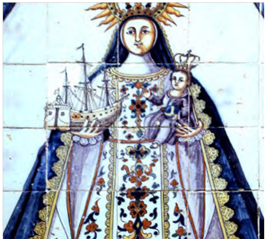
Figura 8 y 9 . Retablo de Arcos de la Frontera

El siguiente retablo fechable en el siglo XVIII, es de cierta calidad y lo encontramos en la localidad de Arcos de la Frontera (Cádiz). Está muy bien conservado y se localiza en la calle Maldonado. La Virgen, cobijada bajo dosel y cortinas, resalta monumental sobre el fondo blanco y una gran peana. Son muy hermosas las flores y los tallos vegetales que adornan su vestimenta barroca, propia de la corte de los Austrias.