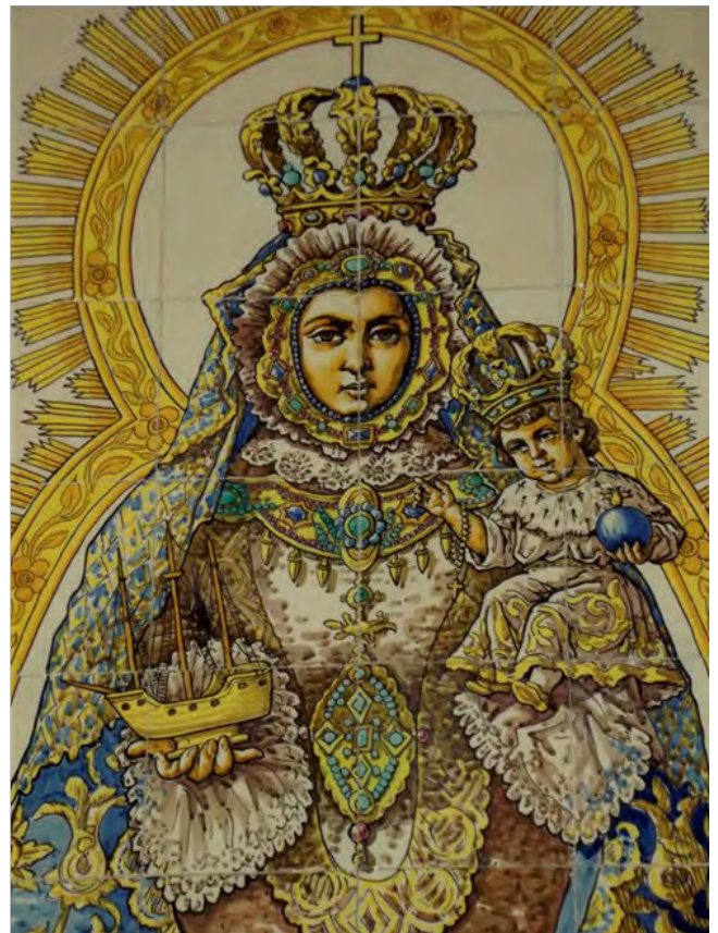
Figuras 14 y 15. Retablo del Instituto Británico de Sevilla y detalle del mismo.