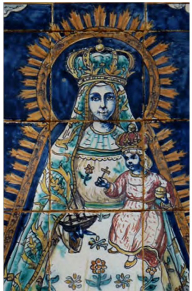
Figura 16 y 17. Retablo cerámico de la hacienda Puyón.