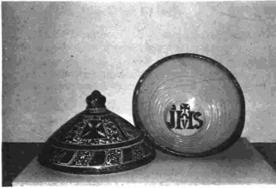
Pila bautismal de Huel (Zaragoza)

Seseña (pág. 92) de "La cerámica popular de Castilla la Nueva".