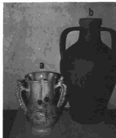
a.—Jarra de Lorca (Murcia) b.—Cántaro de boda de Arroyo de la Luz (Cáceres)