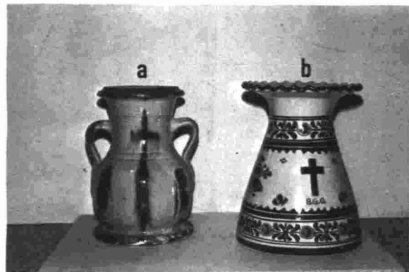
a.—Jarro de Cementerio de Tobarra (Albacete) b.—Jarro de Cementerio de Talavera de la Reina

La cerámica, pues, verá relegado su papel a un segundo plano, ya sea para contener flores, ofrenda permitida, o como elemento funcional indicativo del enterramiento (lápida funeraria).