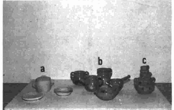
a.—Lilos de Buño (La Coruña) b.—"Obretas" de Val de Uxó (Castellón) c.—"Anafre" de Arroyo de la Luz (Cáceres)

Platillas: son platos pequeños para servir peladillas y confites, adoptando un perfil característico octogonal. Su número oscilaba entre 12 y 14 y se colocaban en el vasar de la chimenea.