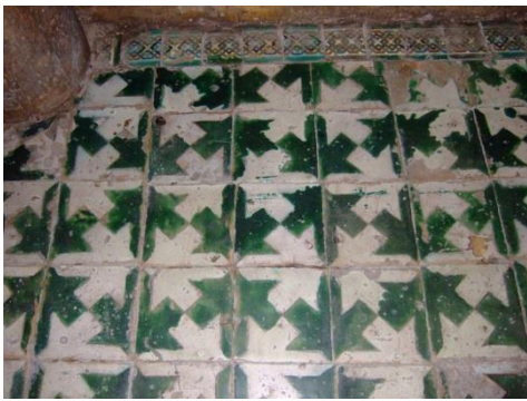
Fig. 25 Mezquita-Catedral de Córdoba. Capilla de la Trinidad. Pavimento.

Se combinan allí, algo desordenadamente, azulejos de formato grande con patas de gallo blancas y verdes (Fig. 25). El motivo es similar al que se ve en el convento de Santa Inés de Sevilla o los que revisten el patio do Esguicho del Palacio Nacional de Sintra. En el centro del pavimento se forma una alfombrilla con las proporciones de una laude sepulcral con azulejos de arista primitivos, decorados con motivos geométricos. En zonas residuales más intervenidas aparecen mezclados otros azulejos de cuerda seca y de arista, todos ellos sevillanos y datables a finales del siglo XV.