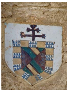
Fig. 23 Iglesia de Santiago. Jerez de la Frontera (Cádiz). Escudo de don Diego Hurtado de Mendoza.

Un escudo similar a éstos se encuentra en el exterior de la iglesia de Santiago en Jerez de la Frontera (Cádiz) obras promocionadas por este cardenal entre 1496 y 1502 (Fig. 23) 25 .