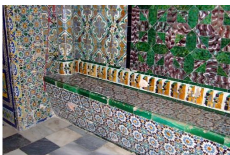
Fig. 11 Monasterio de Sta. Paula. Sevilla. Zócalo y banco del presbiterio de la iglesia.

En el presbiterio de la iglesia se conserva un alto zócalo de azulejos formado por grandes paños de motivos alternos de dos tipos: uno de ellos está pintado a la cuerda seca hendida e imita un tejido brocado muy frecuente a fines del siglo XV. El otro tipo es sumamente original porque, mediante un goteo de esmaltes de varios colores, imita jaspes. Estos últimos no todos son cuadrados sino que, siguiendo el modelo de Manises, combina cuadrados con hexágonos. Se remata el zócalo con una crestería de tipo gótico de cuerda seca hendida, pintada de negro sobre fondo blanco. Por debajo de este zócalo discurre, en el lado izquierdo, un banco revestido en su frente con azulejos de arista del tipo más temprano y con alizares verdes (Fig. 11).