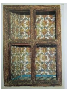
Fig. 17 Casa de los Pinelo. Antigua recámara, hoy capilla. Alacena.

Se han conservado por fortuna los azulejos que revisten interiormente la taca que se abre en el muro. Son unos hermosos azulejos de reflejos dorados, de técnica mixta de arista reforzada con perfilados a pincel con esmalte azul sobre las líneas del relieve (Fig. 17).