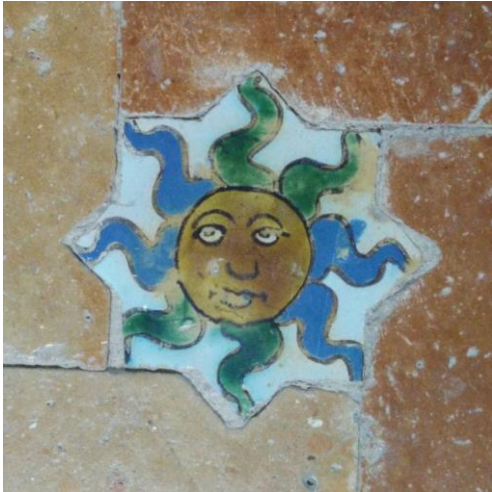
Fig. 20 Convento de Sta. Clara. Carmona (Sevilla). Pavimento coro alto.

En el coro bajo y también en el pavimento del claustro, aunque de forma más dispersa en su colocación, se localizan también de azulejos de cuerda seca hendida, de ocho modelos diferentes que vemos repetidos en el frontal de Alanís (Sevilla y en el claustrillo de la Cartuja (Fig. 8) en la capilla de la Casa de Pilatos y otros, como el que aquí se reproduce que encontramos también en el pavimento de la capilla de la Trinidad de la mezquita-catedral de Córdoba (Fig. 21).