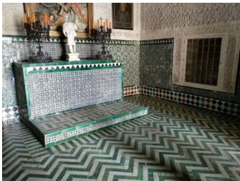
Fig. 1 Casa de Pilatos. Oratorio. Sevilla.

Este edificio que contiene uno de los más completos conjuntos de azulejos de arista conocidos, incluye un grupo de ellos, de cuerda seca, especialmente interesante por presentar características especiales que lo apartan de los tipos más habituales. Se trata del oratorio del palacio y conserva tanto el zócalo como el pavimento y el revestimiento de la mesa de altar. Se perciben en el zócalo un basamento de azulejos dispuestos en damero diagonal, un remate, de alicatado, de almenas dentadas y unos paños centrales en los que se alternan tres motivos fondo incluyendo unos de cuerda seca, los más primitivos, y otros de arista en algunas partes renovadas (Fig. 1).