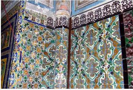
Fig. 12 Monasterio de Sta. Paula. Sevilla. Zócalo del presbiterio de la iglesia.

En el lado derecho, formándose con seis placas rectangulares, figura un escudo con las armas de las familias Enríquez y Portugal, respectivamente, en alusión a los personajes aquí enterrados (Fig. 13).