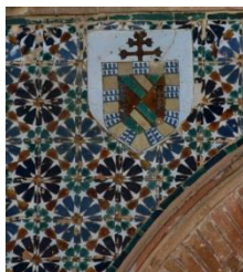
Fig. 22 Iglesia de Santa María. Villalba del Alcor (Sevilla). Albanega de la portada Sur.

revestidas con azulejos de cuerda seca, en este caso, hendida, con estrellas de nueve puntas, decoradas con los cinco colores habituales (Fig. 22).