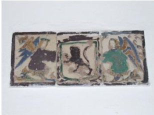
Fig. 14 Monasterio de Sta. Paula. Sevilla. Escudo de la Orden Jerónima.

En el interior del convento, se conservan dos paneles formados cada uno de ellos por tres placas, pintadas de cuerda seca plana que representan el escudo de la orden jerónima, sostenido por dos ángeles (Fig. 14). Hay piezas semejantes en el Museo Británico de Londres y en el antiguo monasterio de los monjes jerónimos de Granada.