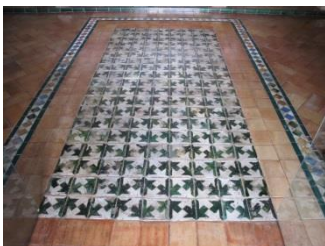
Fig. 15 Convento de Sta. Inés. Sevilla. Refectorio.

A la entrada del refectorio de este convento se conserva una almatraya de un tamaño considerable, formada por 171 azulejos de cuerda seca del motivo de la pata de gallo, en colores alternos verdes y blancos. Fueron restaurados en 1993 por la empresa Excisa 22 . Se trata de un tipo de azulejos de 19 x 19 cms de lado y de un grosor superior al habitual por estar muy probablemente destinado de forma preferente a pavimentos (Fig. 15).