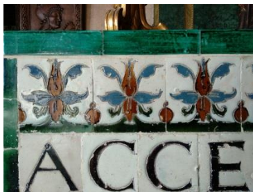
Fig. 16 Casa de los Pinelo. Sevilla. Antigua recámara, hoy capilla. Frontal de altar.

cuerda seca hendida que forman una crestería de diseño gótico muy original sin paralelos conocidos hasta ahora.