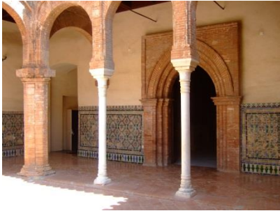
Fig. 5 Cartuja de S a M a de las Cuevas. Claustro. Sevilla.

Es, sin duda, el conjunto más importante de azulejos de cuerda seca sevillana de los conservados, visibles en Andalucía occidental. Se trata de un zócalo que reviste los cuatro muros que forman las galerías de este patio adosado a la iglesia del monasterio (Fig. 5).