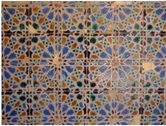
Fig. 7 Cartuja de Sª Mª de las Cuevas. Sevilla. Detalle zócalo.