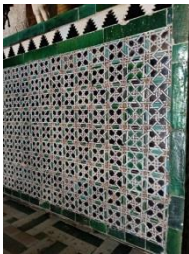
Fig. 3 Casa de Pilatos. Oratorio. Frontal de altar.

También su colorido es especial, sobre todo por el empleo de esmalte verde turquesa, poco habitual en Sevilla hacia 1500. Por otro lado, el frontal del altar está revestido con azulejos de cuerda seca hendida, de formato 9 x 9 cms y decorado con lacería más menuda (Fig.3).