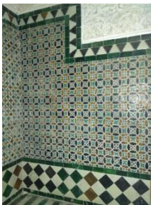
Fig. 4 Casa de Pilatos. Oratorio. Zócalo. Detalle

Finalmente un tercer motivo de lazo, más frecuente, reviste el muro de los pies (Fig. 4).