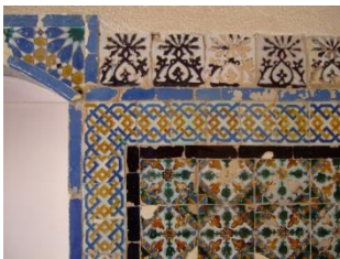
Fig. 8 Cartuja de Sª Mª de las Cuevas. Sevilla. Detalle zócalo.