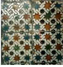
Fig. 26 Iglesia parroquial de San Lorenzo. Córdoba. Frontal de altar.