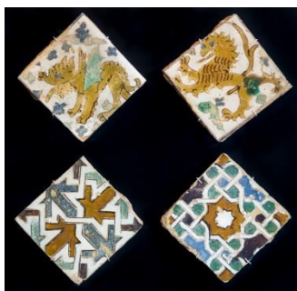
Fig. 18 Centro Cerámica Triana. Sevilla. Azulejos de cuerda seca procedente del ex monasterio de la Encarnación.

Un pavimento doméstico que se conservaba en excelente estado fue descubierto en 1992 y hubo de ser desmontado para la continuación de las obras proyectadas en la Plaza de la Encarnación de Sevilla. El conjunto se componía de azulejos de cuerda seca y de olambrillas de arista del tipo más temprano 24 . Los primeros responden a un repertorio con motivos figurativos y también de lazo mudéjar. Las olambrillas de arista son todas de motivos geométricos y de una ejecución de delicada. Cuatro de los azulejos de cuerda seca han sido expuestos en el Centro Cerámica de Triana (Fig.18).