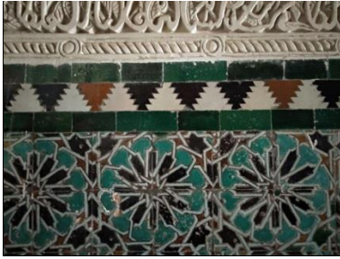
Fig. 2 Casa de Pilatos. Oratorio. Sevilla. Detalle zócalo.

También su colorido es especial, sobre todo por el empleo de esmalte verde turquesa, poco habitual en Sevilla hacia 1500. Por otro lado, el frontal del altar está revestido con azulejos de cuerda seca hendida, de formato 9 x 9 cms y decorado con lacería más menuda (Fig.3).