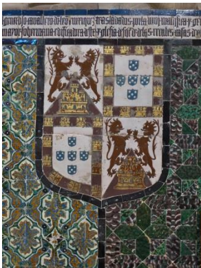
Fig. 13 Monasterio de Sta. Paula. Sevilla. Zócalo del presbiterio. Escudo de la Casa de los Marqueses de Montemayor.

En el lado derecho, formándose con seis placas rectangulares, figura un escudo con las armas de las familias Enríquez y Portugal, respectivamente, en alusión a los personajes aquí enterrados (Fig. 13).