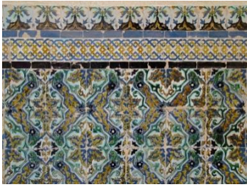
Fig. 6 Cartuja de Sª Mª de las Cuevas. Sevilla. Detalle zócalo.