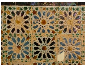
Fig. 9 Cartuja de Sª Mª de las Cuevas. Sevilla. Detalle zócalo.