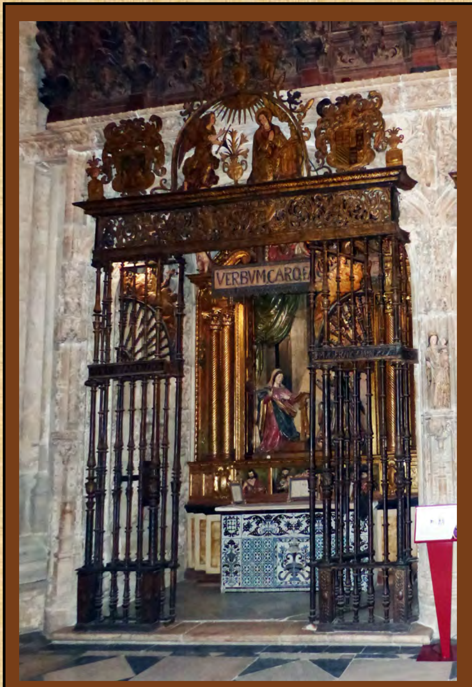
Vista general de la Capilla de la Encarnación de la Iglesia Catedral de Sevilla

La composición del frontal queda centrada por un hermoso jarrón diseñado por Gestoso años antes y que aquí reforma en algunos elementos. Este jarrón ya aparece en el zócalo de su propia vivienda de la calle Gravina que pintara Manuel Rodríguez Pérez de Tudela en 1902. En el caso del frontal se añade en la parte superior el anagrama de María coronado y rodeado de un resplandor, las azucenas son de mayor tamaño y es diferente la inscripción de la banda inferior la cual recoge la siguiente frase: “virtus altissimi obumbrabit tibi”, que está tomada del evangelio de Lucas y del pasaje de la Encarnación del Hijo de Dios y viene a decir lo siguiente: “el poder del Altísimo te cubrirá con su sombra”.