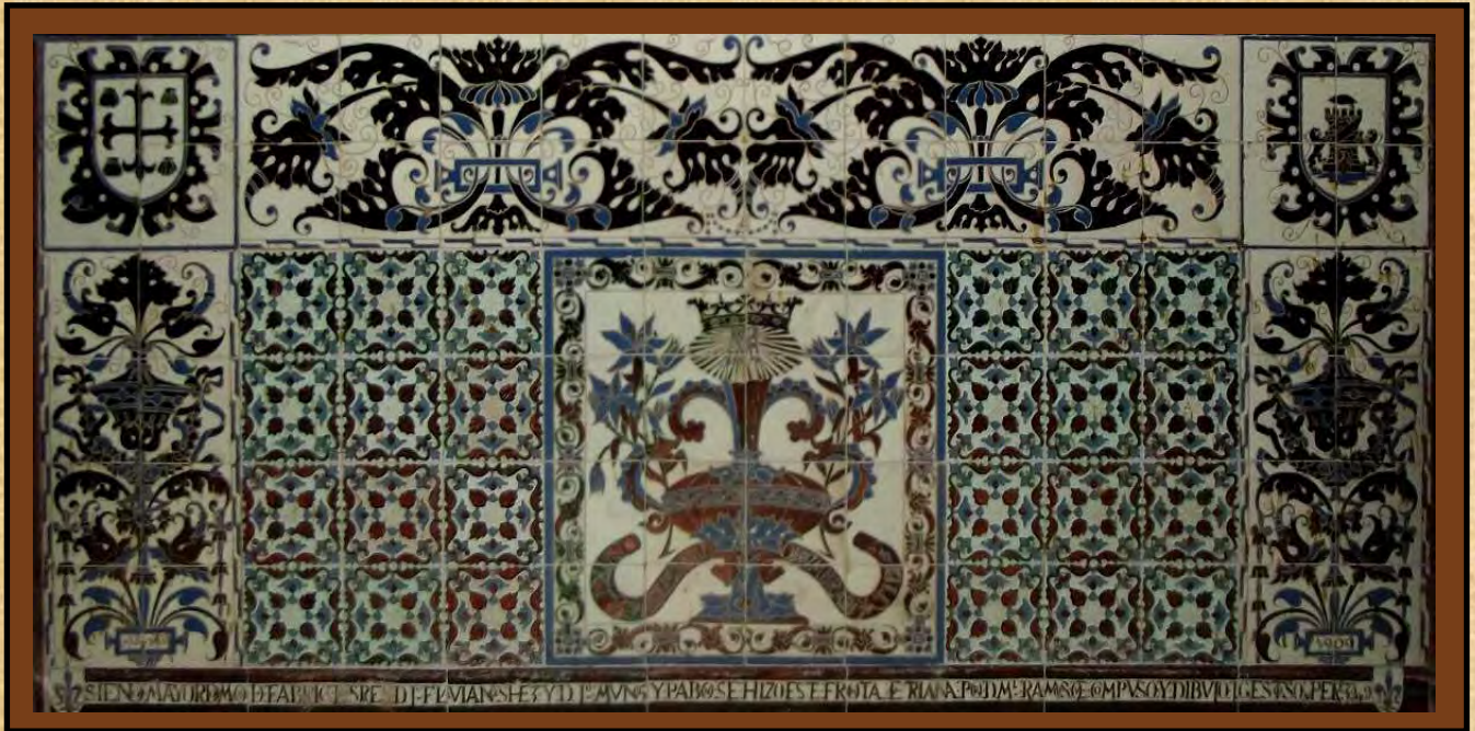
Vista completa del frontal de altar

De sobra es conocida la vinculación de José Gestoso con las personalidades más destacadas de Sevilla y con las más importantes instituciones de la misma. De entre todas estas destacó su relación con la Catedral de la ciudad y su Cabildo, siendo diversas las muestras de amistad y desavenencias con los canónigos a lo largo de los años.