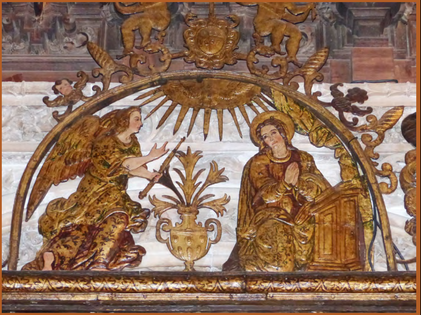
Detalles de la verja de la Capilla de la Encarnación