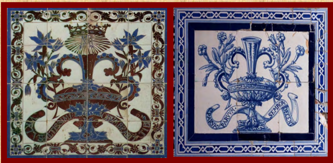
Detalle del jarrón central del frontal

el cabildo catedralicio al matrimonio formado por Juan Serón Olarte y Antonia de Verástegui, cuyos escudos se ubican en el remate de la reja que la cierra y se reproducen también en las esquinas superiores del frontal que nos ocupa.