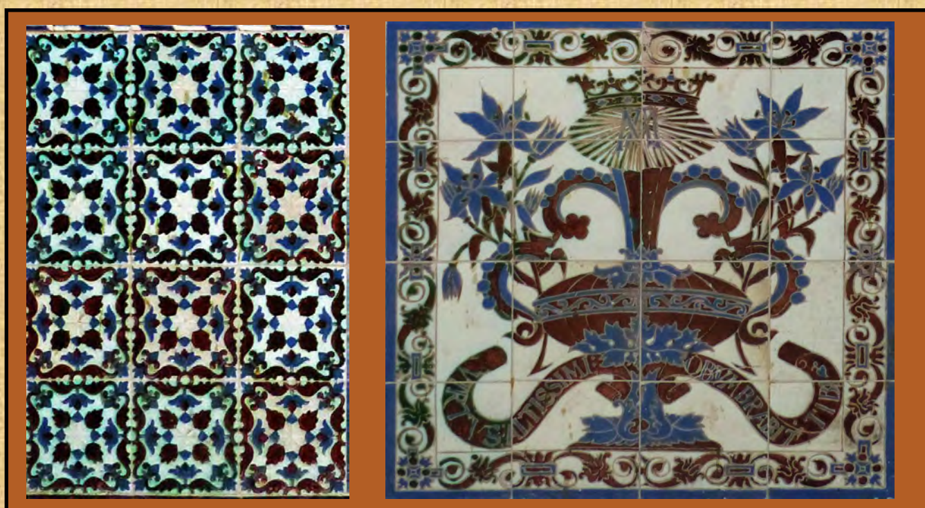
Detalles frontal altar: azulejos y jarra