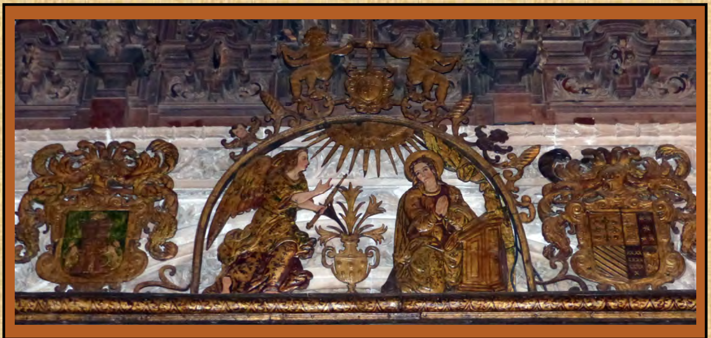
Remate de la reja donde se aprecian los escudos de los fundadores que se reproducen en el frontal