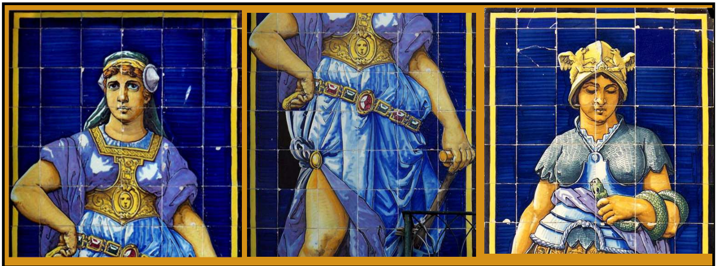
Fotos: Detalles del dibujo de los rostros y pliegues de la vestimenta.

Las dos figuras destacan por su postura corporal, sus ropajes, los pliegues, los complementos que acompañan a la vestimenta y la concepción monumental de las figuras. Además es muy rico el colorido de los paneles, destacando el excelente fondo azul con una marcada pincelada horizontal.