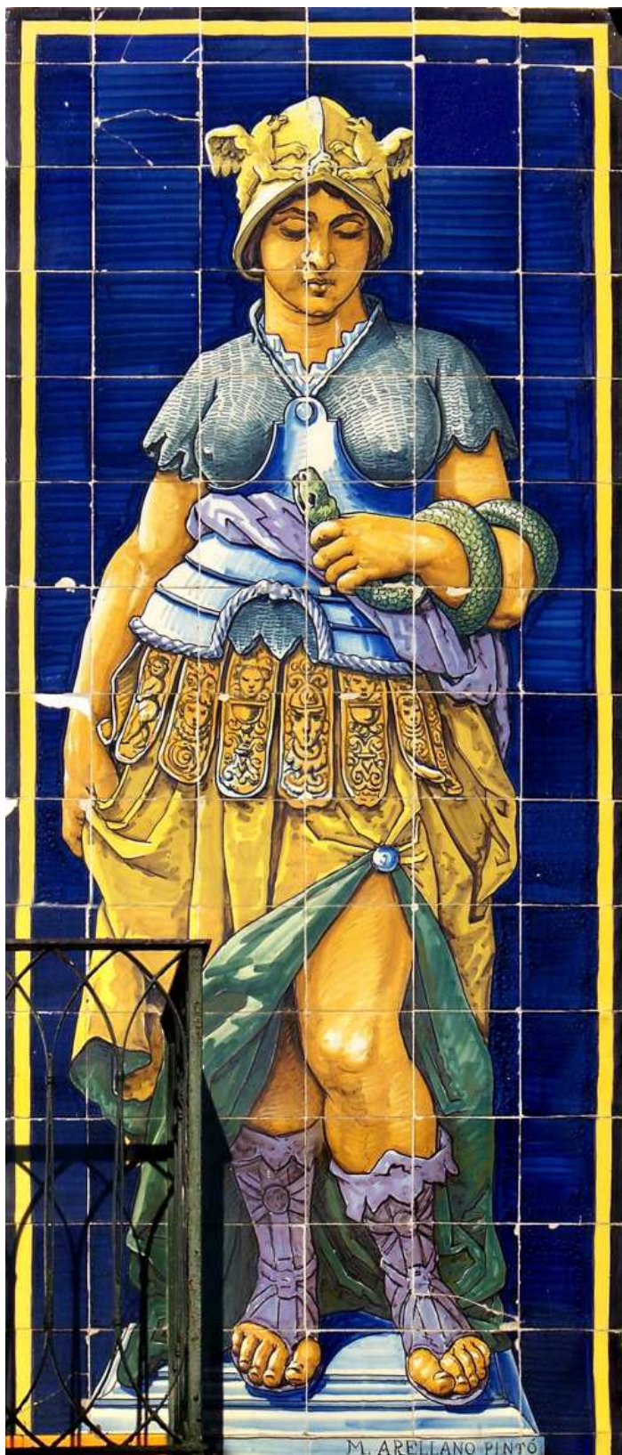
Fotos: izquierda, alegoría del Trabajo. Derecha: alegoría de la Prudencia.