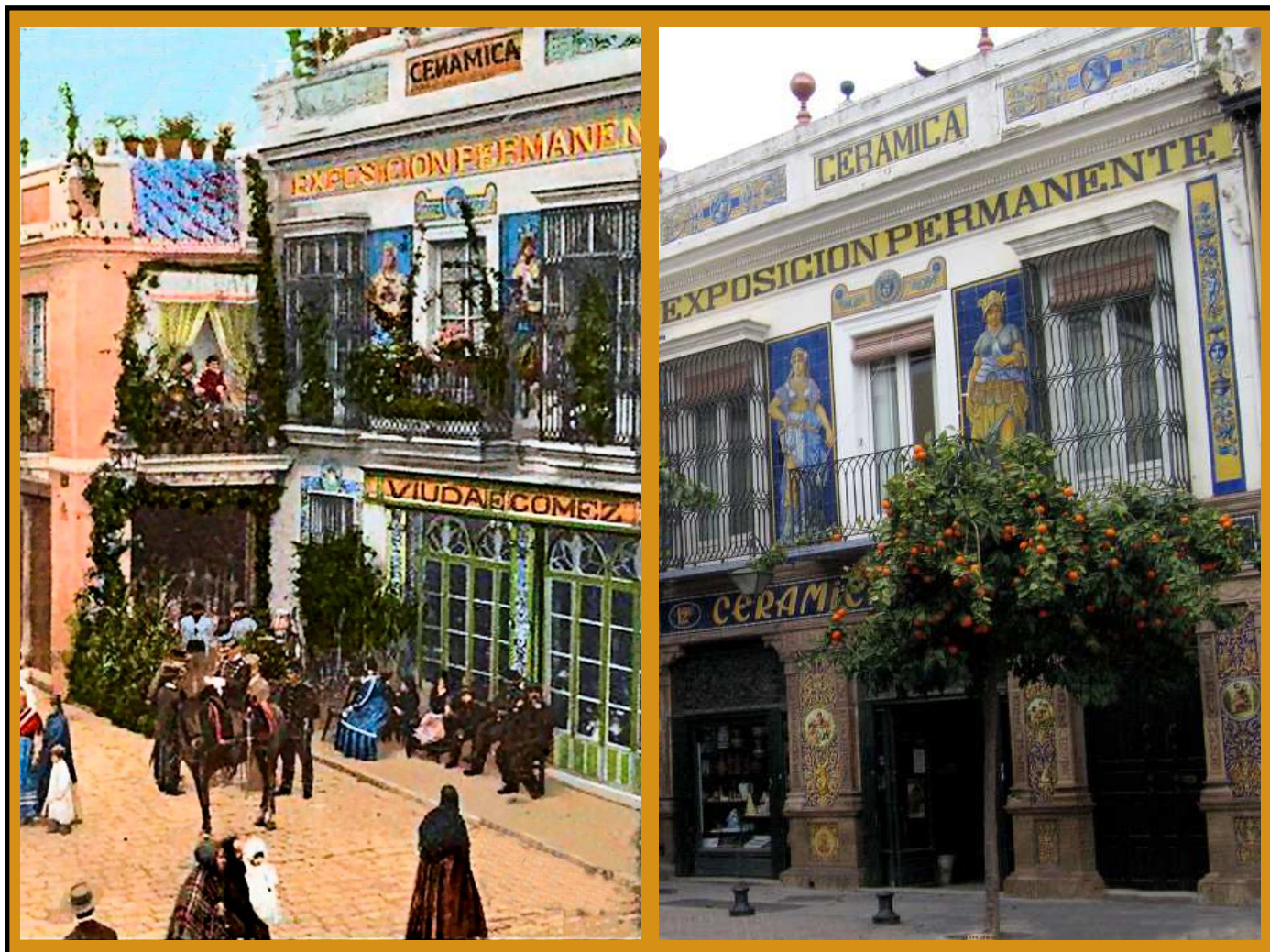
Postal turística de principios del XX.