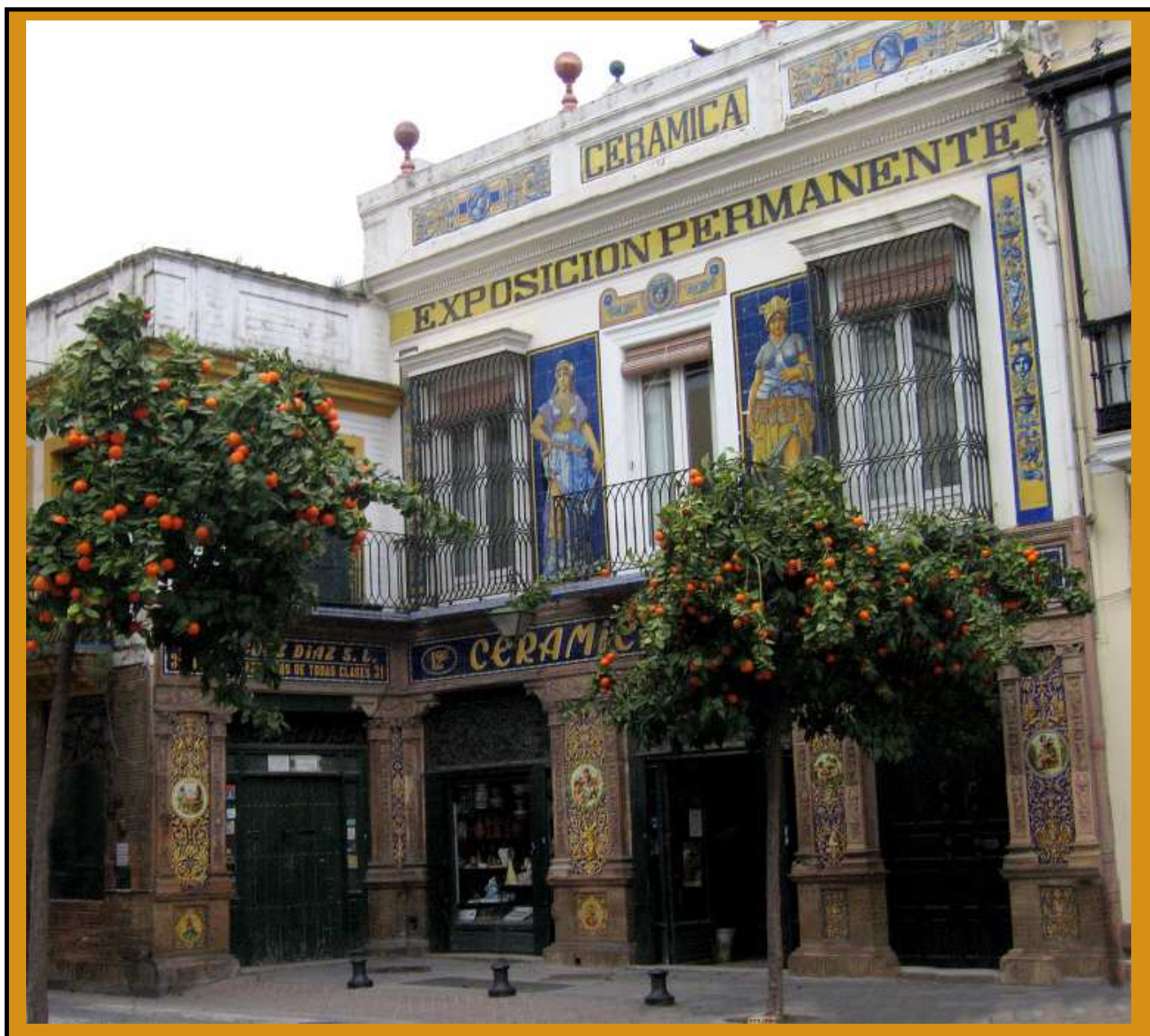
Fotos: Balconada con las alegorías y fachada actual, calle san Jorge. Retabloceramico.net