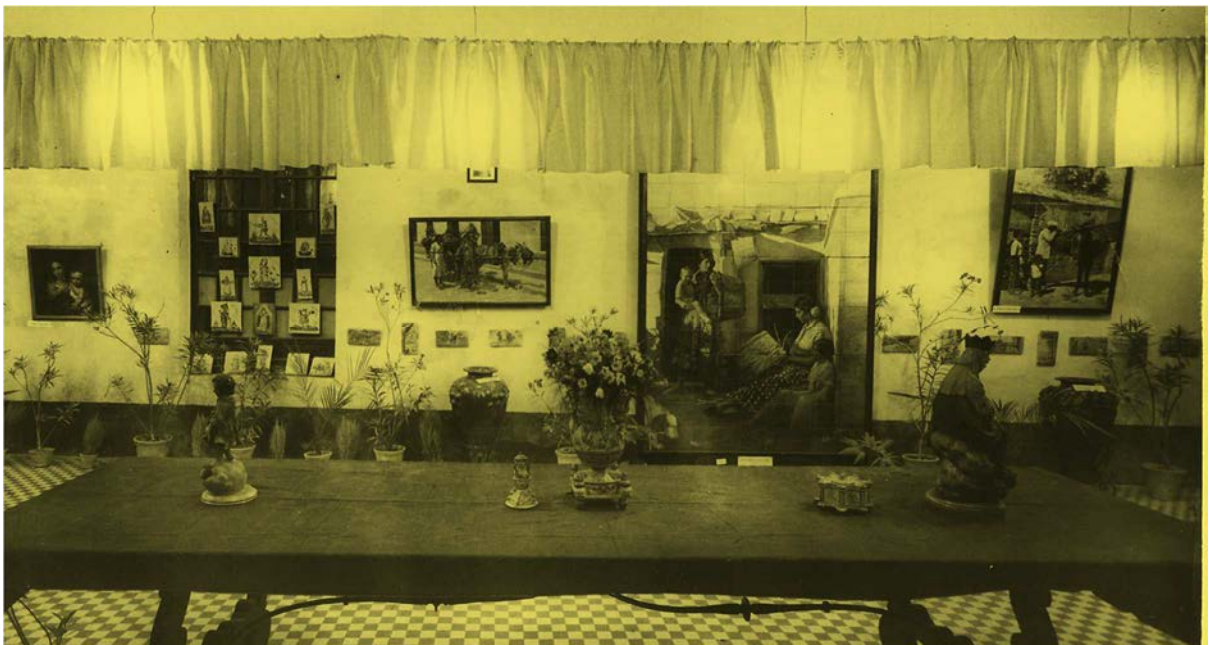
Imágenes de la Exposición en la Sociedad Económica de Amigos del País. 1948