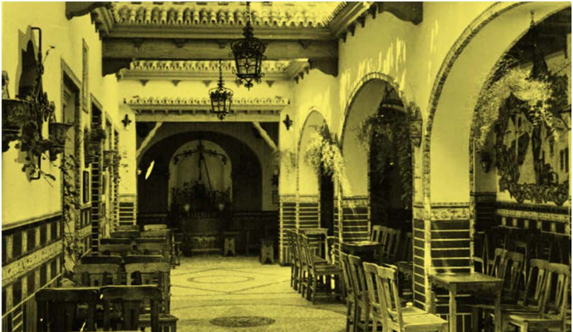
Interior del desaparecido Bar el Cañaveral en Triana, tomado de Triana en la red.

A partir del cierre de este establecimiento y su posterior derribo, se desconocen los avatares que sufrió la obra de Orce y las manos por las que haya ido pasando. Lo cierto y seguro es que desde ese momento nadie conoce el paradero, ni aún hoy a pesar de haber transcurrido más de 67 años. Un hecho lamentable que dio lugar a quejas y posicionamientos de personalidades sobre su desaparición.