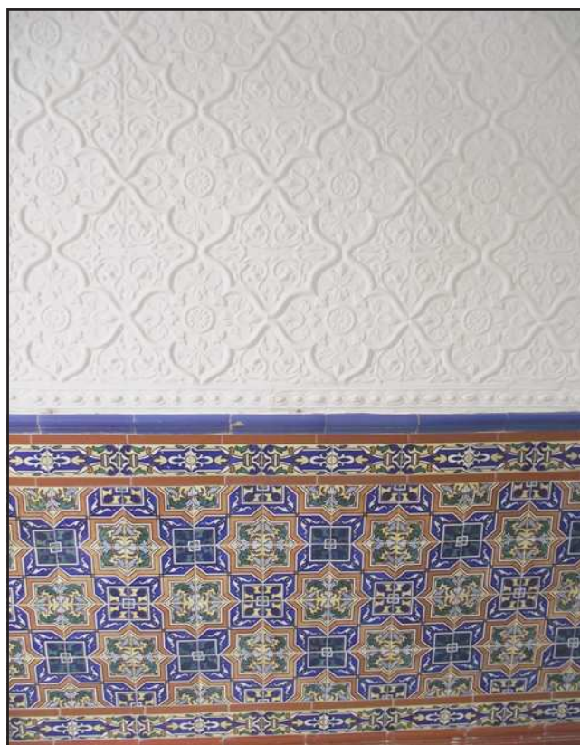
Ilustración 3.- Zócalo de azulejos lisos y por encima placas cerámicas en relieve, encaladas. Calle Nuestra Señora de la Luz, 5.