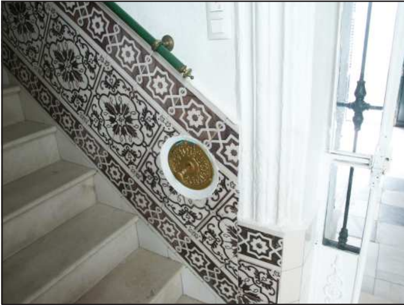
Ilustración 4.- Azulejos imitación de mármol. Calle Jerez, 18.