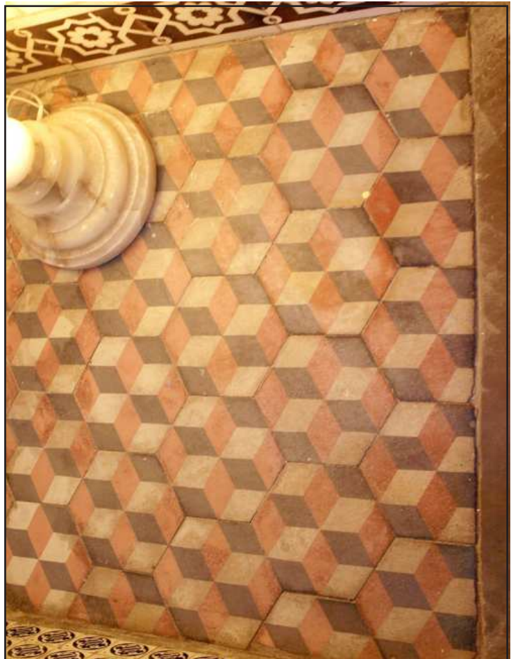
Ilustración 10.- Pavimento de mosaico hidráulico con motivos geométricos. Calle Silos, 9