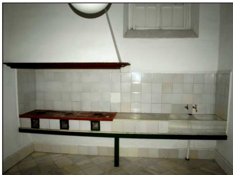
Ilustración 6.- Cocina con azulejos, humera y pila de mármol. Calle Coronel Francisco Valdés, 4.