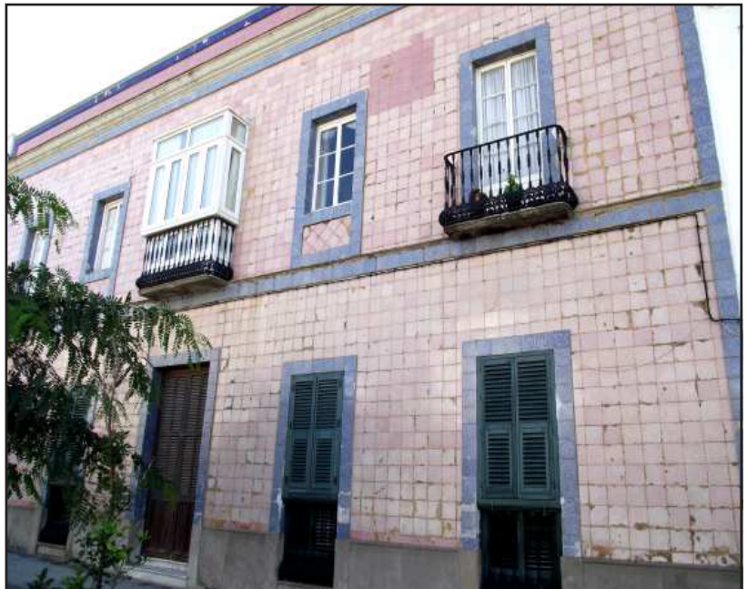
Ilustración 5- Azulejos en fachadas. Calle Coronel Francisco Valdés, 4.