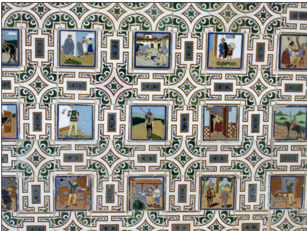
Ilustración 1.- Azulejos de cuerda seca representando a Don Quijote. Calle Sancho el Bravo, 21.