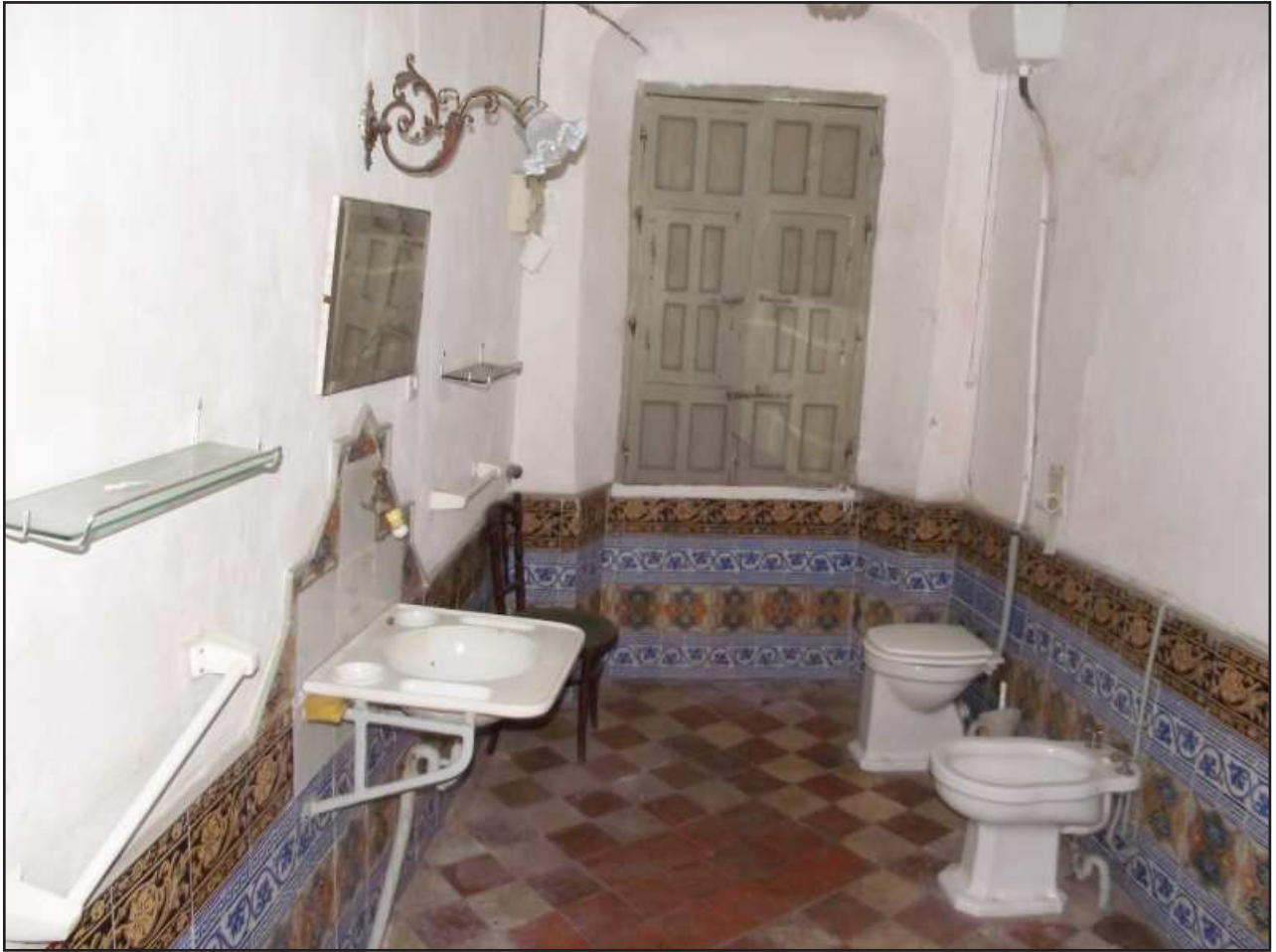
Ilustración 7.- Cuarto de baño. Calle Nuestra Señora de la Luz, 11