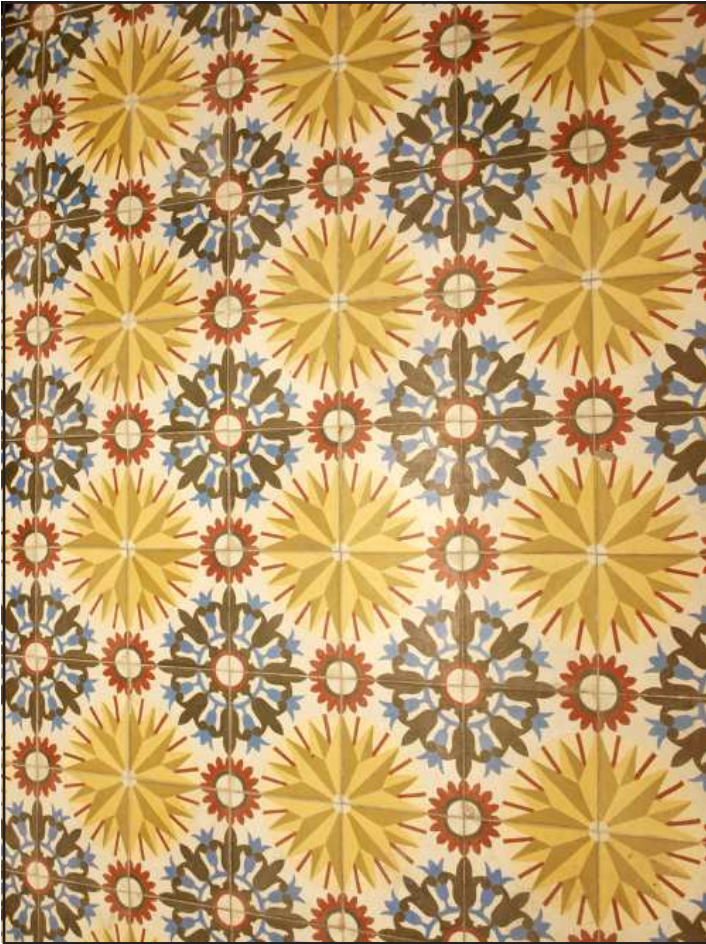
Ilustración 9.- Pavimento de mosaico hidráulico con motivos curvos. Calle Jerez, 9.