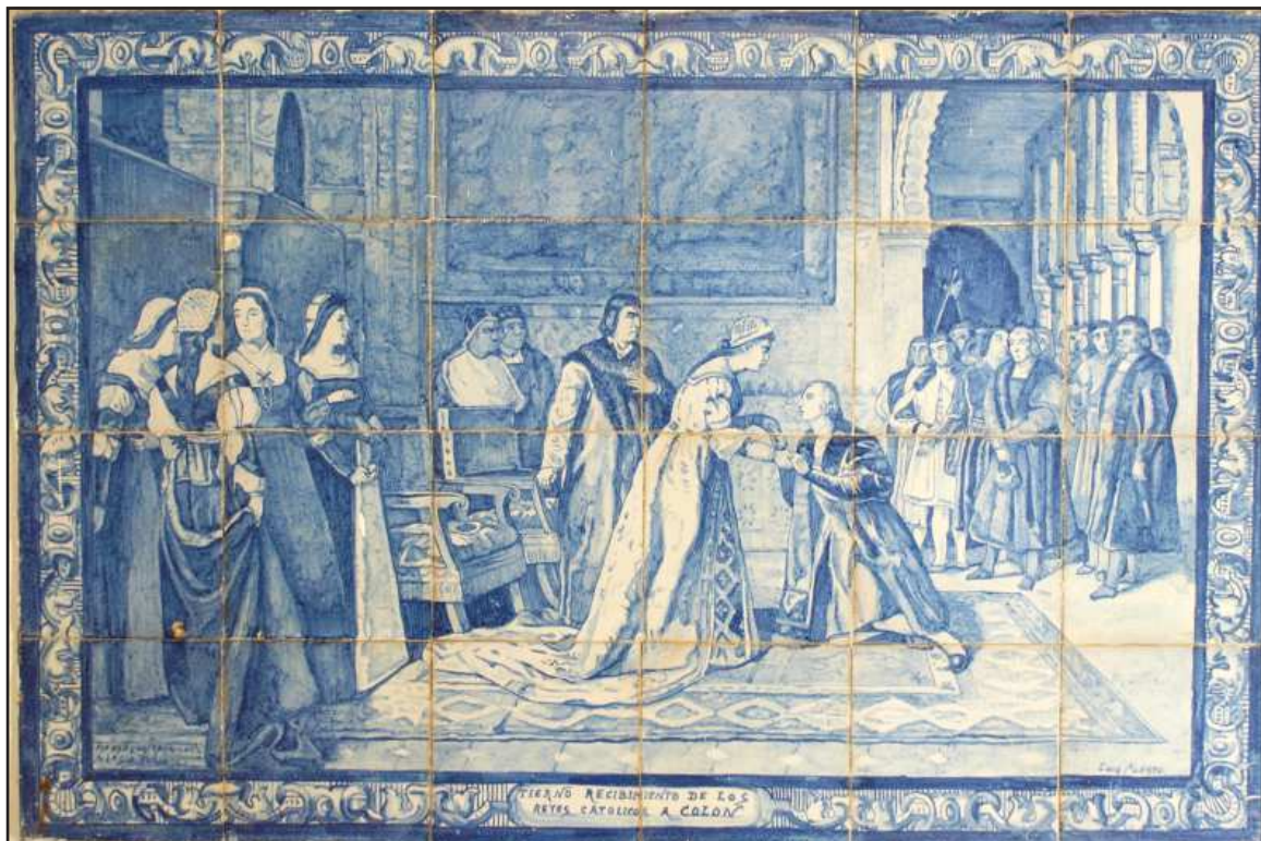
Ilustración 8.- Panel cerámico con la escena del recibimiento de los Reyes Católicos a Colón. Calle Moreno de Mora, 4.