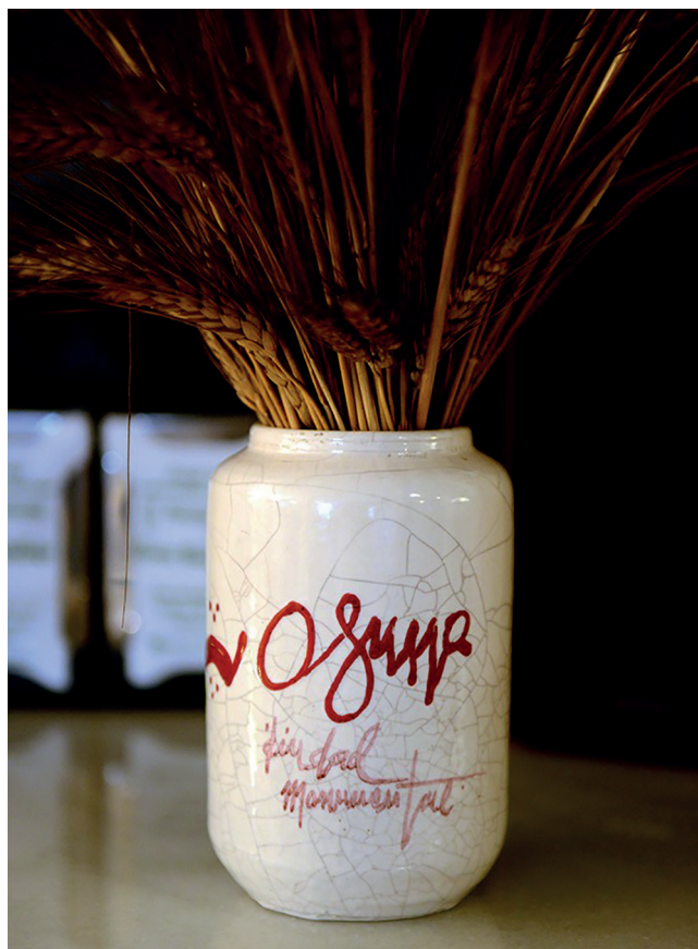
TARRO VIDRIADO Y DECORADO CON EL LOGOTIPO OSUNA CIUDAD MONUMENTAL. FINALES SIGLO XX,