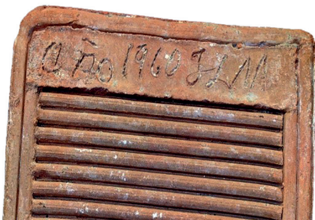
RESTREGADERA CON EL TEXTO INCISO EN EL BARRO: AÑO 1960 J A M.