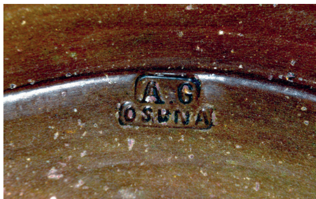
CUÑO EN LA BASE DE LEBRILLO DE OSUNA DE ANTONIO GARCÍA EN LA CALLE CALDENEGRO, 9 DE OSUNA. ACTIVO EN EL AÑO 1894.