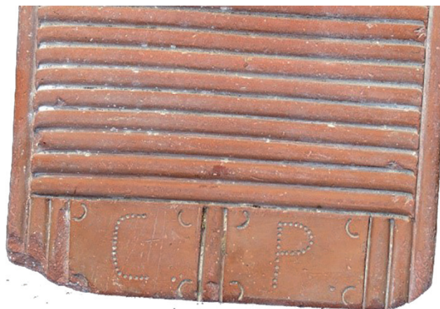
RESTREGADERA CON LAS INICIALES POSIBLEMENTE DE SU PROPIETARIA C P.

diferenciándolas de piezas similares de otros alfareros o de otros pueblos con tipologías afines, como eran los lebrillos de Osuna y Lora del Río y los cántaros con semejanza a los de Herrera, Puente Genil, Lucena o Palma del Río. También existía la variante de identificar la pieza con el nombre del nuevo propietario, muy frecuente entre las marcas y cuños.