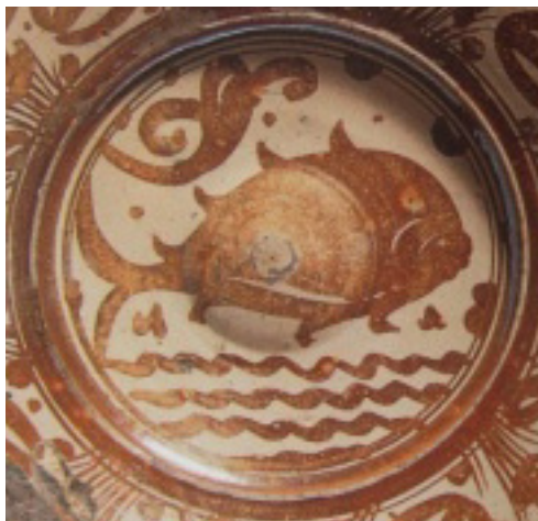
Fig. 8 Umbo central de plato sevillano de loza dorada.