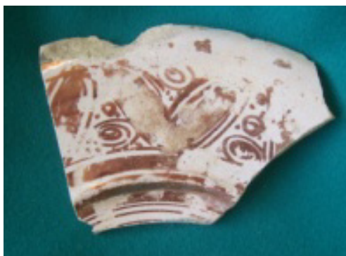
Fig. 2 Fragmento plato loza dorada. Excavación C/Valladares (Sevilla). Depósito del Museo Arqueológico de Sevilla (VI-2, 121, bolsa RFM-5).

la evidencia arqueológica más contundente de la producción sevillana de loza de reflejo dorado. Aunque los materiales no han llegado a ser dibujados ni publicados, los perfiles de platos y escudillas, su tamaño, su peso y los motivos de su decoración en reversos y anversos inclinan a pensar que todos ellos pertenecen a un grupo de fabricación tardía que datamos a fines del siglo XVI o inicios del XVII y al que corresponden muchas de las obras completas que hallamos en colecciones privadas y públicas 14 .