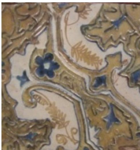
Fig. 7 Frontal de altar. Capilla de Maese Rodrigo (Sevilla). Detalle.

Con este mismo motivo textil se decoraron los azulejos del frontal de altar de la capilla del Colegio Santa María de Jesús, germen de la Universidad de Sevilla, capilla que fue construida en 1506. Esta obra, analizada en detalle, desveló un curioso hecho que nos ha dado una valiosa clave para poner en relación los azulejos con la loza. Tres azulejos de este conjunto completan la ornamentación del mencionado motivo textil, aparentemente de forma casual y caprichosa, con rosas y flores de helechos que son algunos de los motivos más frecuentes en las piezas pertenecientes al grupo de platos que considero sevillanos (Fig.7).