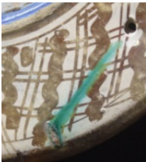
Fig. 10 Orificio y mancha accidental de vedrío verde.

Teniendo en cuenta que este dato no ha sido localizado en ningún plato de comprobada procedencia valenciana ni catalana, lo podemos considerar como un indicio más de probable procedencia sevillana.