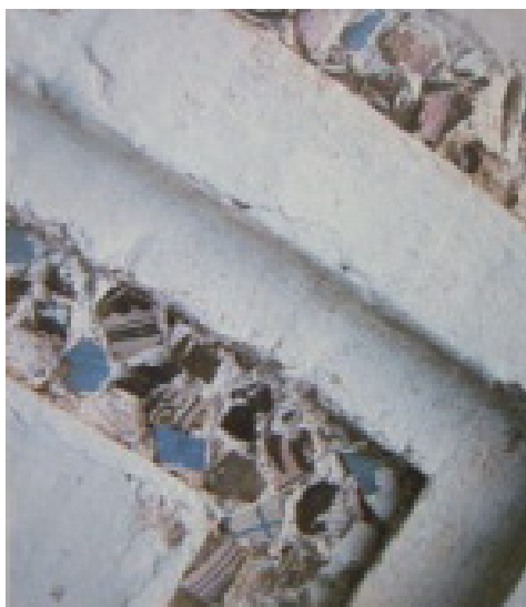
Fig. 3 Fragmentos de loza dorada. Iglesia de Corterrangel, Aracena (Huelva)

Pero no sólo en el subsuelo hallamos evidencias materiales de estas cerámicas doradas sino también en el patrimonio monumental y coleccionístico. En el primero de ellos, pueden ser mencionados dos conjuntos arquitectónicos renacentistas ubicados en tierras del antiguo Reino de Sevilla, hoy provincia de Huelva. En ellos se pueden apreciar multitud de fragmentos de loza dorada de este grupo de piezas, embutidos en el mortero de muros y bóvedas, formando molduras ornamentales en estos edificios. Uno de los conjuntos, datable hacia 1565, es el de la portada de la iglesia de la aldea de Corterrangel (Aracena) (Fig. 3) y el otro, datado exactamente en 1603, es una bóveda de la iglesia de Santa María de la Asunción de Aracena. Esta labor ornamental que también se aplicó a veces a las fuentes de jardines manieristas, se hacía con desechos defectuosos de cocciones y esto confirma nuevamente que estas piezas habían sido fabricadas y desechadas en Sevilla en las fechas mencionadas.