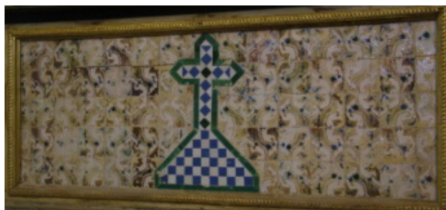
Fig. 6 Frontal de altar. Iglesia de S.ª María, Trujillo (Cáceres)

se comprueba por el perfilado de algunos ejemplares que se conservan en colección privada sevillana y en una alacena de la casa de los Pinelos de Sevilla, hoy Real Academia de Bellas Artes de Santa Isabel de Hungría.