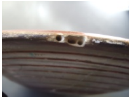
Fig. 1 Toma de muestra en plato de la Colección Carranza (Cat. 1996, n.º 80)

El plato elegido presentaba todas las características que inicialmente se asociaban al grupo que suponía sevillano (Fig. 1). Por suerte, los análisis