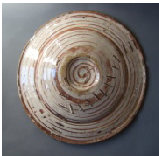
Fig. 12 Decoración de un reverso con línea espiral.

Una novena característica sería la sencilla decoración de los reversos de los platos que en más de un 90 % es una simple espiral en tanto que los platos valencianos poseen decoraciones mucho más elaboradas (Fig. 12).