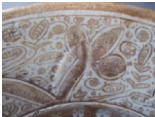
Fig. 11 Decoraciones disociadas en relieve y pintura.

gallones etc.) y que, sin embargo, se desarrolla con independencia de éstos (Fig. 11).