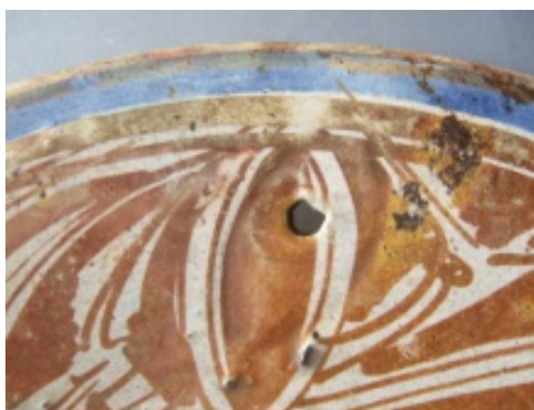
Fig. 9 Orificio para colgar de un plato sevillano se loza dorada.

A diferencia de los grandes platos valencianos que suelen presentar dos orificios junto al labio para ensartar en ellos el cordón del que colgar la pieza de la pared, las piezas sevillanas de este grupo suelen presentar en la inmensa mayoría de los casos un solo orificio (Fig.9).