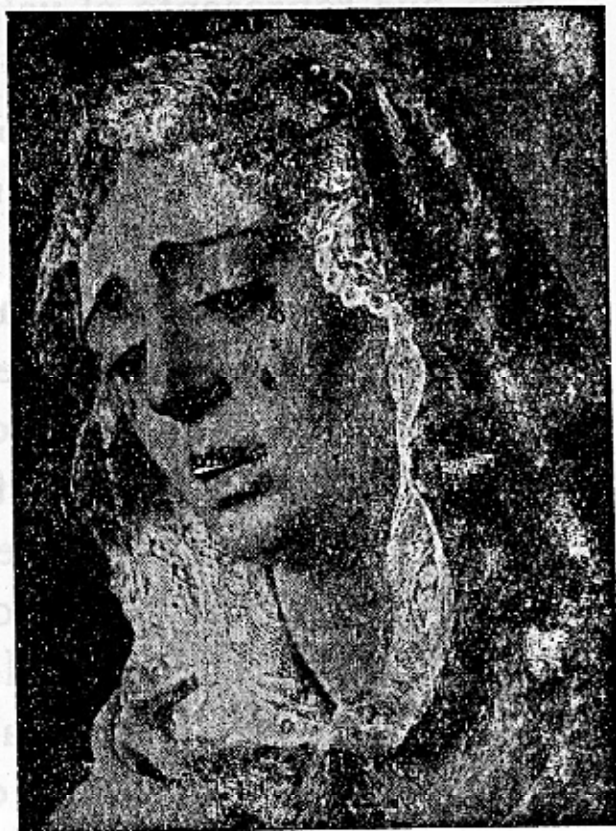
NUESTRA SEÑORA DE LA ESTRELLA Magnífica escultura de Martínez Montañés IGLESIA DE SAN JACINTO