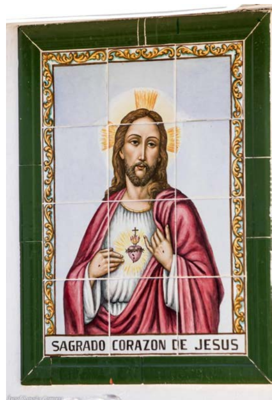
Panel sin firmar hacia 1950. Publicado por Angel España Carreras