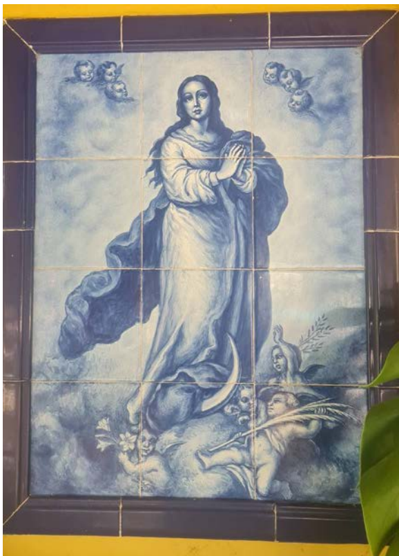
Panel sin firmar. Publicado por Francisco Criado

Trabajó gran parte de su vida como pintor cerámico en Iliturgi S.A. hasta que esta cerró a mediados de los años 60. Su producción principal en el ámbito de la azulejería fueron las escenas religiosas, principalmente de la aparición de la Virgen de la Cabeza. Algunos han sido publicados en el grupo de Amigos de la Cerámica de Andújar: