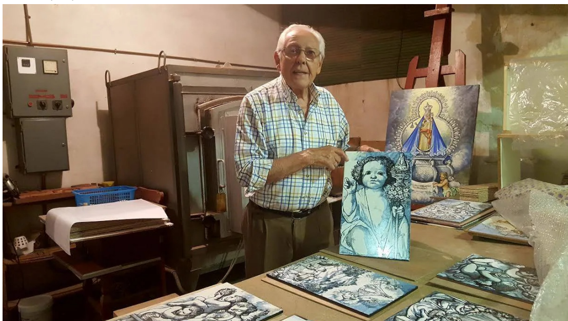
Fotografía publicada en el diario IDEAL 18/5/2018