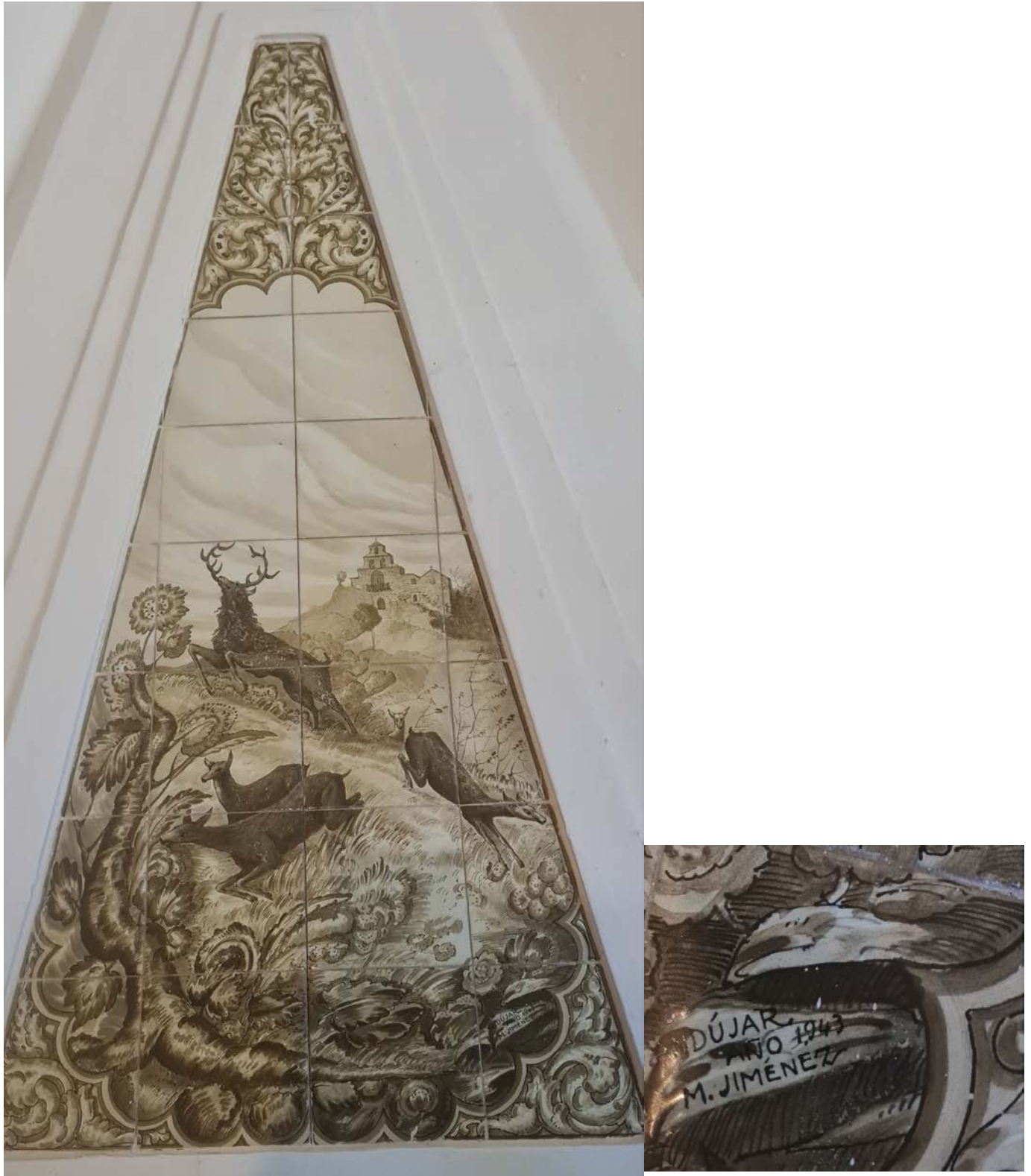
Decoración cerámica del tiro de una chimenea por Manuel Jimenez Orgambide en 1943.

Manuel Jiménez Orgambide pintó muchos murales cerámicos distribuidos por varios edificios de Andújar. Pero para ejemplificar su producción azulejera voy a reproducir alguna de las muestras que se han publicado en el grupo de Amigos de la Cerámica de Andújar ( https://www.facebook.com/groups/1304340773777293/ ) que tengo el honor de administrar desde hace unos meses. Concretamente me refiero al recubrimiento del tiro de una chimenea con un panel triangular con tema de montería, firmado por el autor, y la decoración de unos bancos en la misma casa de campo, realizadas en 1943, cuyas fotos presentó en el grupo Francisco Criado.