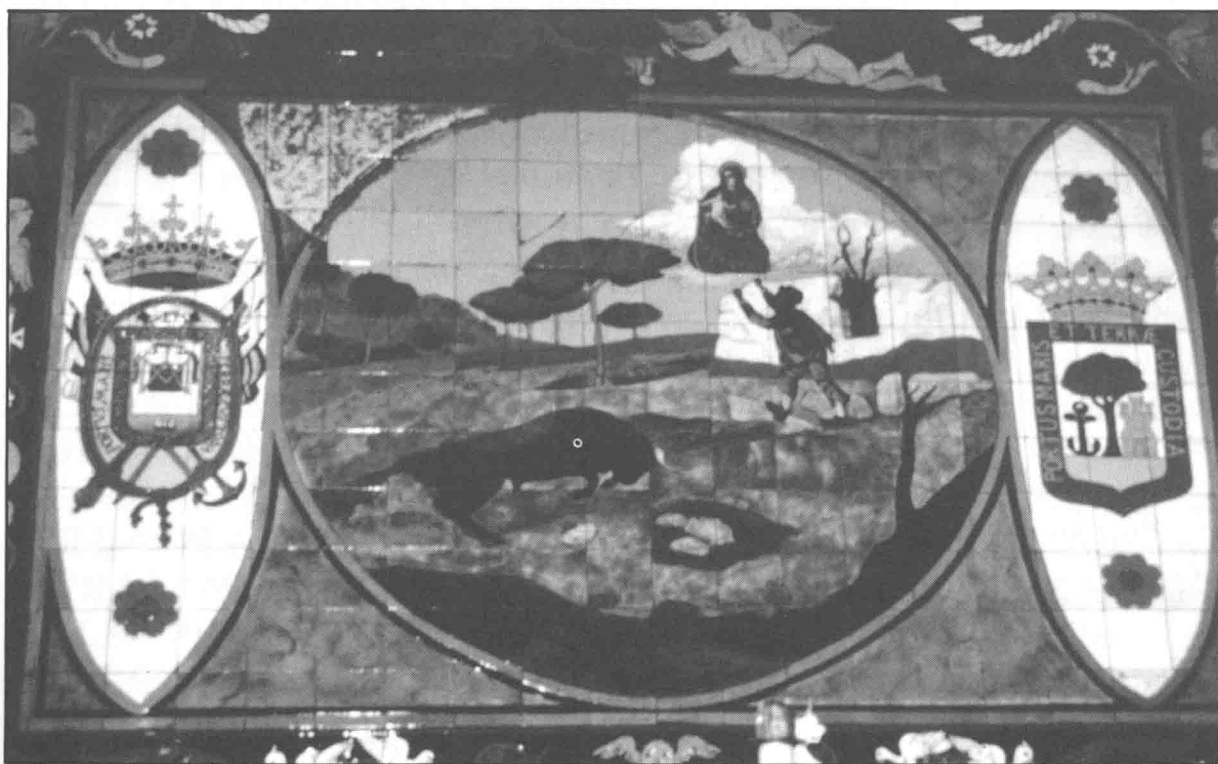
Lám. 4.- Presbiterio: El milagro del toro. Daniel Zuloaga, 1920.

La autoría de este azulejo queda totalmente esclarecida ya que, en la zona inferior del óvalo lateral que enmarca el escudo heráldico de Huelva, se lee con toda claridad la firma del artista: «DANIEL ZULOAGA» (lám. 4).