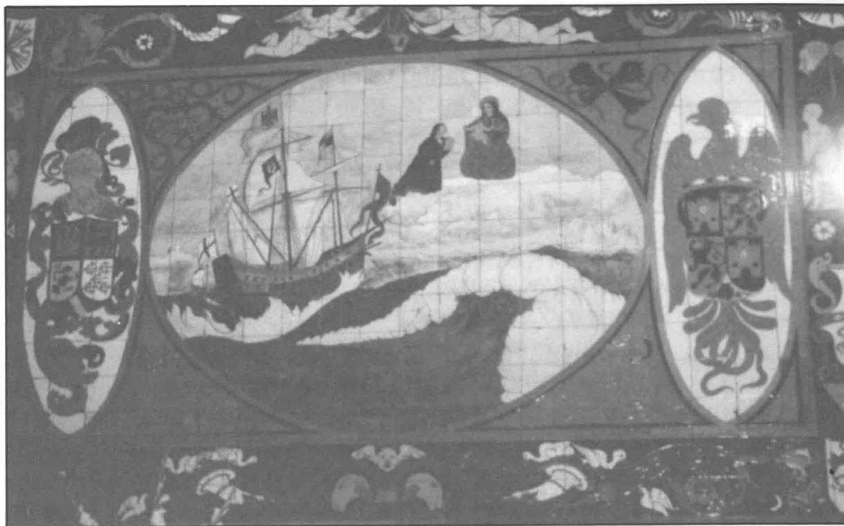
Lám. 5.- Presbiterio: Aparición de la Virgen de la Cinta al Almirante Colón. Daniel Zuloaga, 1920.