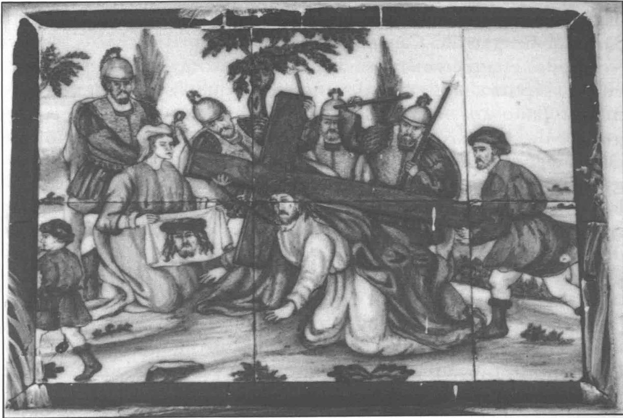
Lám. 2.- Vía Crucis: El paño de la Verónica.