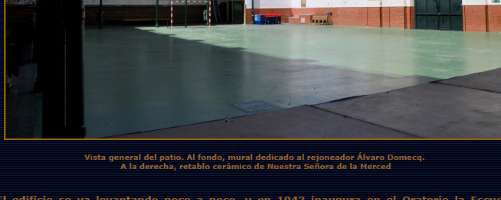
Vista general del patio. Al fondo, mural dedicado al rejoneador Álvaro Domecq. A la derecha, retablo cerámico de Nuestra Señora de la Merced.