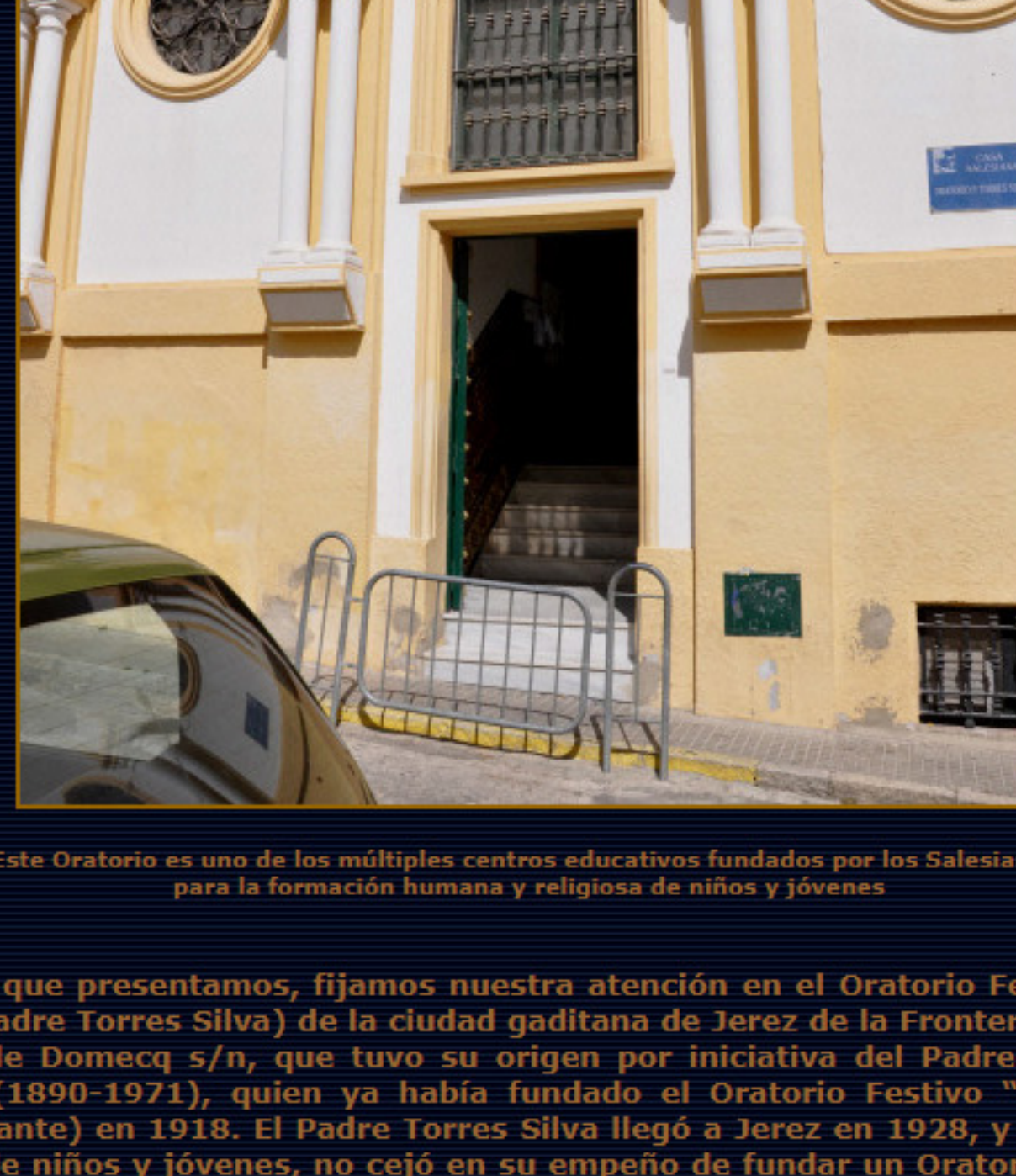
Este Oratorio es uno de los múltiples centros educativos fundados por los Salesianos para la formación humana y religiosa de niños y jóvenes

Los Oratorios Festivos evolucionaron a lo largo de su existencia, especialmente durante el siglo XX, con el fin de que los niños y jóvenes escolarizados en los centros educativos bajo el ideario de San Juan Bosco tuvieran una alternativa nueva de emplear y aprovechar su tiempo libre, superando carencias afectivas y emocionales por medio de actividades recreativas y educativas. El Oratorio era una jornada periódica que buscaba enseñar la palabra de Dios de forma diferente, combinando con la recreación, a la par que procurar en los años de circunstancias económicas y sociales adversas, una alimentación suficiente a niños de escasos recursos. Los Oratorios suelen estar nominados bajo el patronazgo de las imágenes devocionales de la Orden, como María Auxiliadora, o de los Santos, personalidades de la Congregación Salesiana o de otro carácter histórico.