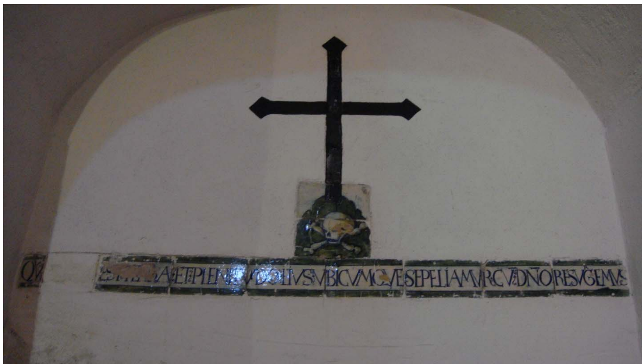
Detalle de la leyenda bajo la cruz

2.- Sobre la sepultura, desconocemos cómo sería originariamente, pero podemos considerar que se trata de un nicho en el que se ha depositado la imagen yacente de un desconocido caballero que bien pudiera tratarse de algún personaje relacionado con el linaje del marquesado de Flores de Ávila, que abarcaba a las localidades cercanas de Císla y Aldehuela, lugares de Flores de Ávila. Sobre ella apreciamos una leyenda junto a un inicio de cruz, a cuyos pies figura una calavera.