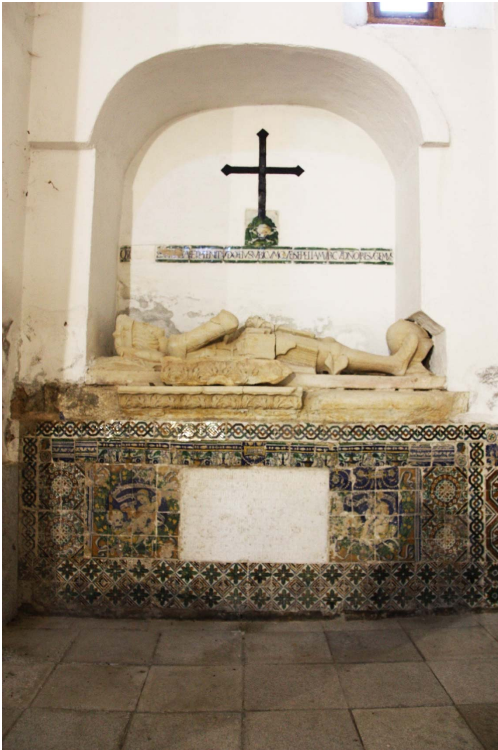
Cenotafio Iglesia Flores de Ávila. Fco. Niculoso Pisano, 1526