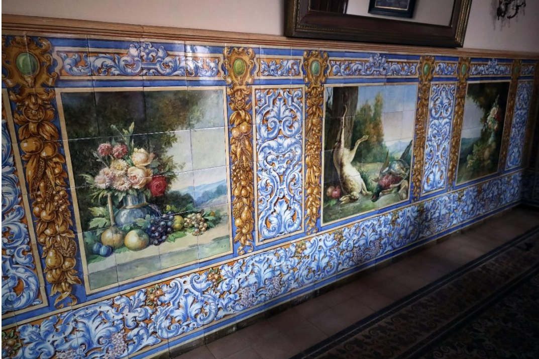
Detalles del zócalo del comedor de la vivienda.

Estos zócalos, realizados en azulejo plano y con una altura de 1,60 metros, se dividen de manera que enmarcan los paneles que podemos apreciar a modo de cuadros representando bodegones de caza o florales, así como escenas de paisaje, en la línea de los que realizaría para la casa de Pichardo en la calle Marqués de la Estrella nº7 en la Palma del Condado. 3