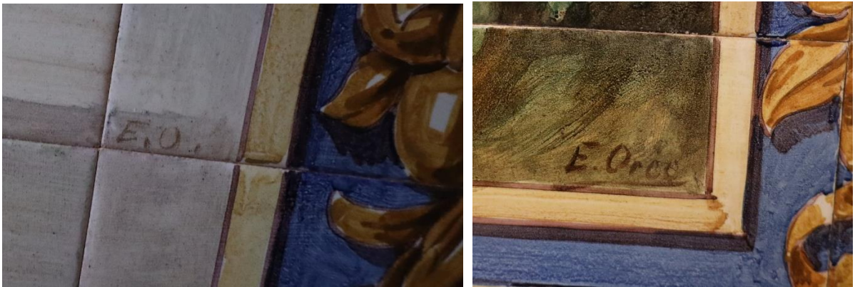
Fotografías de los cuadros cerámicos y detalles de la firma del autor.

No todos los paneles tipo cuadros estarían firmado, es el ejemplo del bodegón con animales o el paisaje, encontrándose firmados todos los demás.