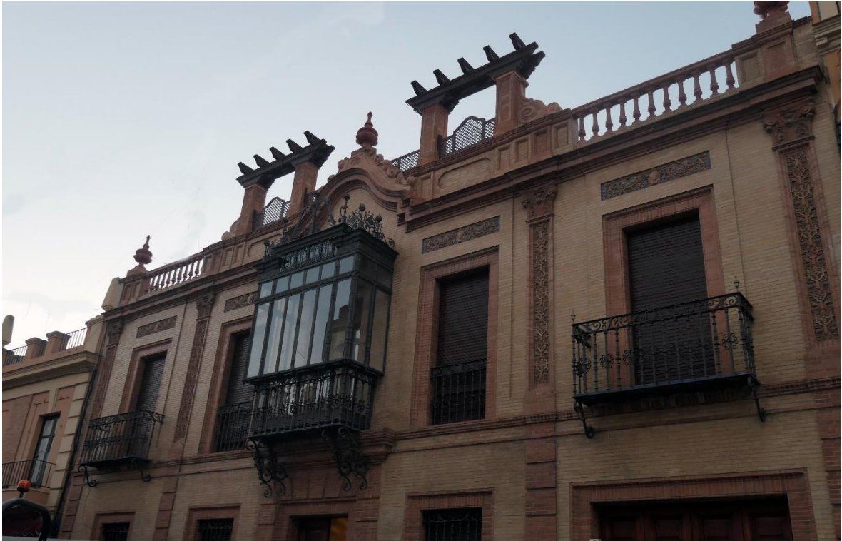
Fachada del domicilio en calle Ntra. Sra. del Águila. Alcalá de Guadaira.