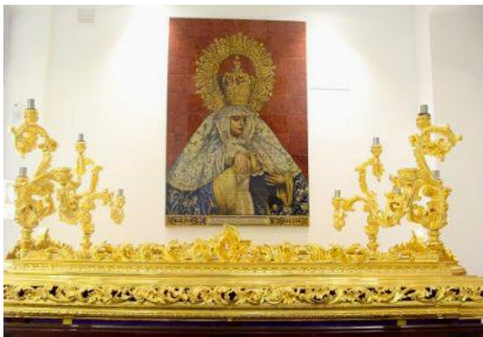
Colocación definitiva del retablo en la Casa de Hermandad

El costo de la reconstrucción fue sufragado por los hermanos, a los que se entregó una tarjeta en la que figuraba una recreación del retablo terminado, haciendo constar su aportación económica.