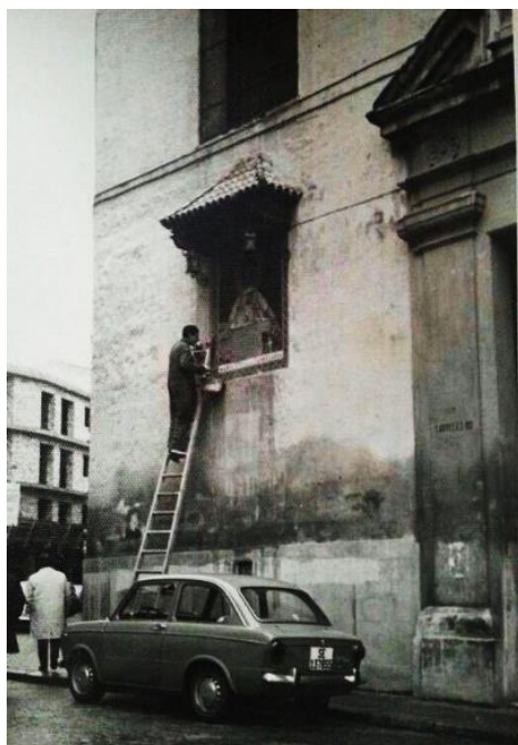
El prioste de la hermandad, Manuel Luque, desmontando en 1970 el retablo para evitar su pérdida total.