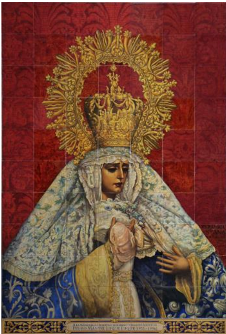
El retablo, de 1947, recuperado en el año 2016