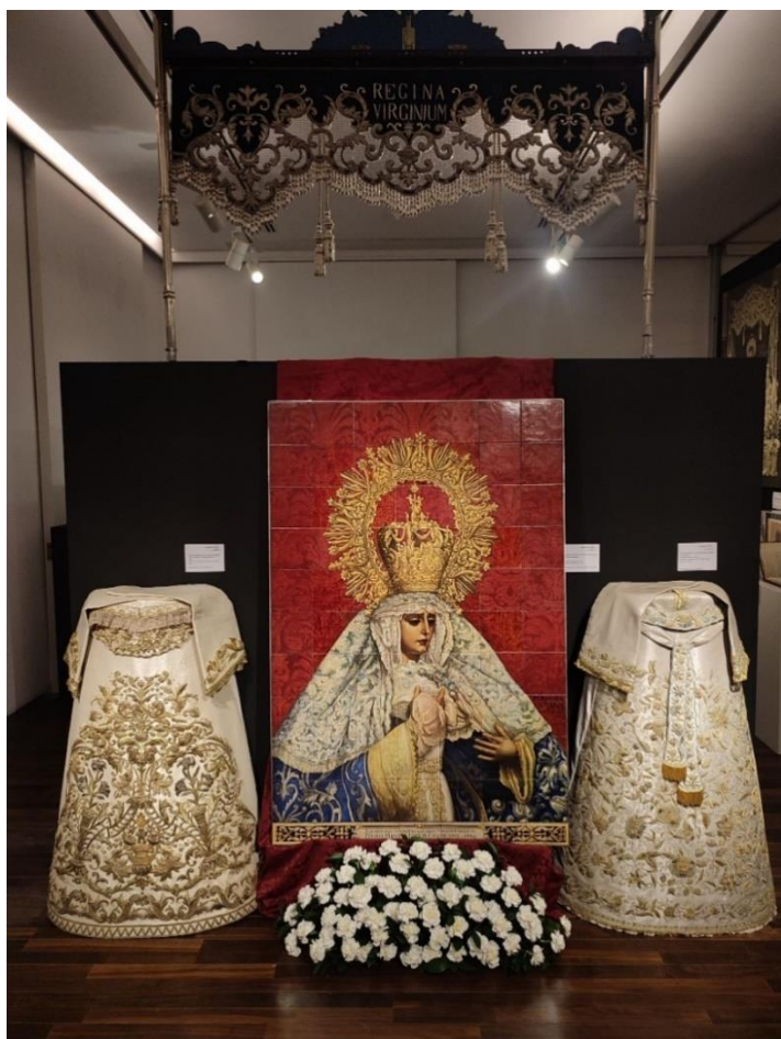
El retablo fue centro de atención en la Exposición celebrada en la Cámara de Comercio de Sevilla en noviembre de 2024