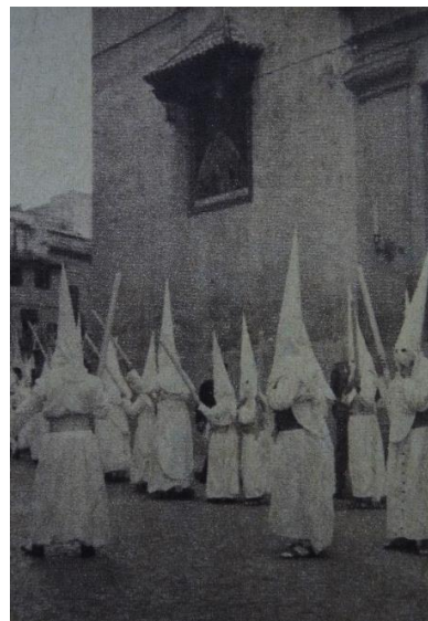
Nazarenos bajo el retablo inaugurado en 1947