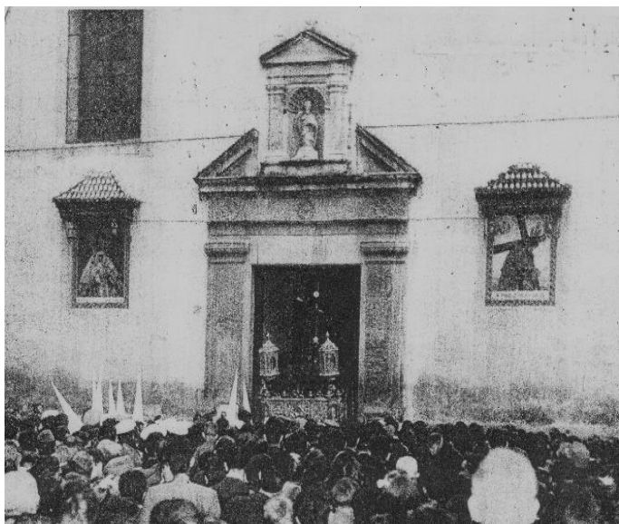
Foto de la salida de la cofradía en la década de 1950