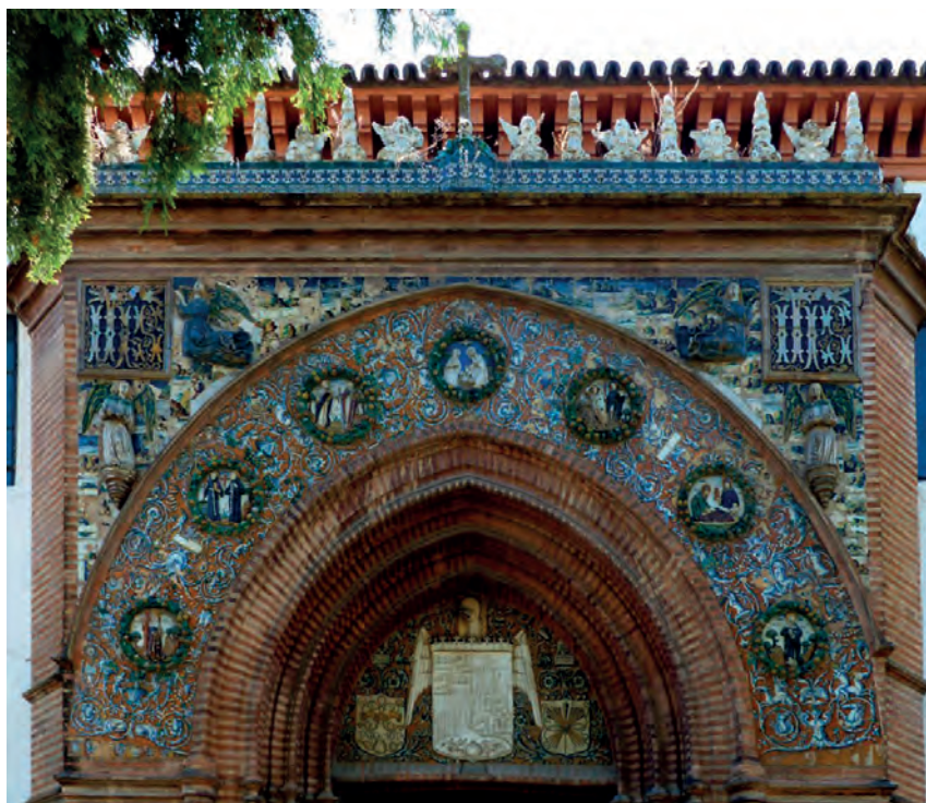
IMAGEN 1. PORTADA CONVENTO SANTA PAULA. NICULOSO PISANO. 1504. SEVILLA